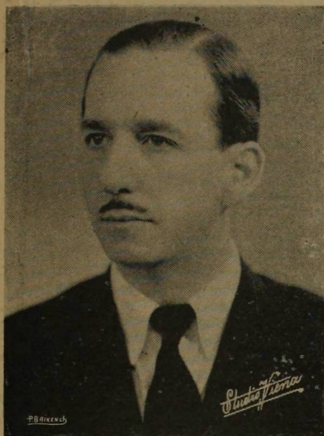
Julián Marchena (1941)

Las más de estas páginas de Alas en Fuga han creado ante mis ojos lienzos, acuarelas, miniaturas colgando de los muros de un vasto boudoir de amores idos.