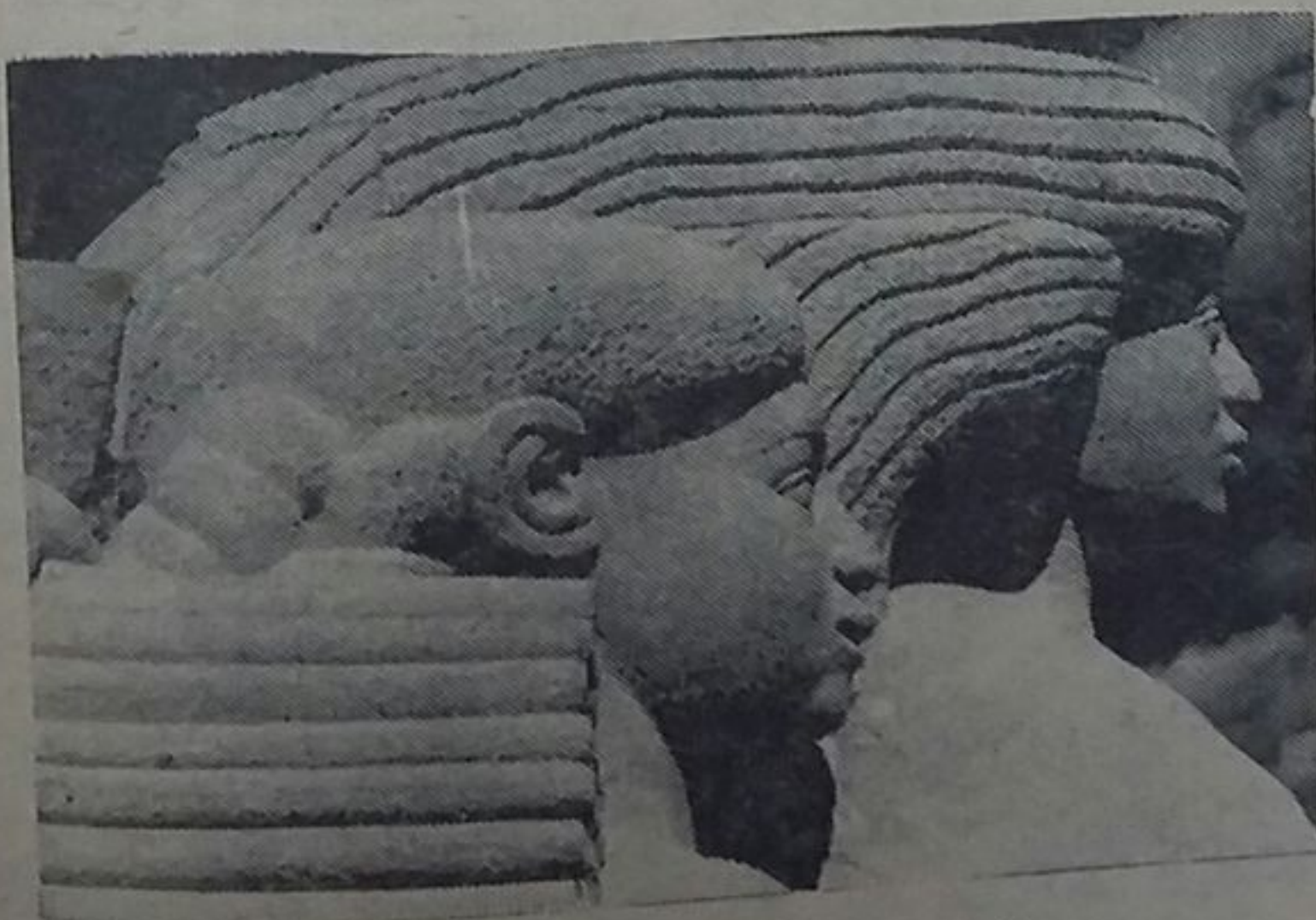
Monumento de Valsequillo. Detalle.