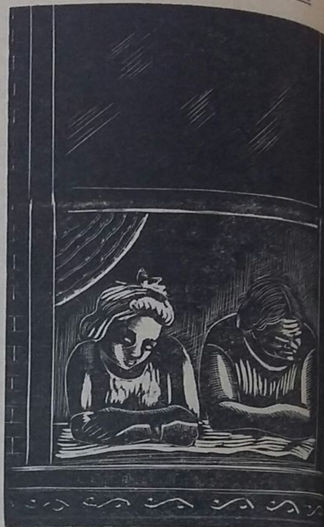
Una de las maderas de Amighetti en Francisco en Harlem .

Es la última de estas manifestaciones de piedad para con el hombre americano del futuro la conferencia de Río compuesta y enaltecida por los cancilleres de los actuales gobiernos del hemisferio que deberían ser geográficamente veintiuno. Esta conferencia convocada con alguna anticipación y cuyo momento inicial fué objeto de varios aplazamientos, debe atender principal y casi únicamente a la defensa del hemisferio. Para subvenir a esta que parece una necesidad imperiosa y no menos urgente, se piensa redactar, discutir y firmar un pacto de todas las repúblicas de América en que se acepta la obligación solemne por parte de cada una de ellas, de defender a una cualquiera de las firmantes del pacto contra agresión proveniente de estados americanos o extranjeros. En cierto modo esta valiente y ge-