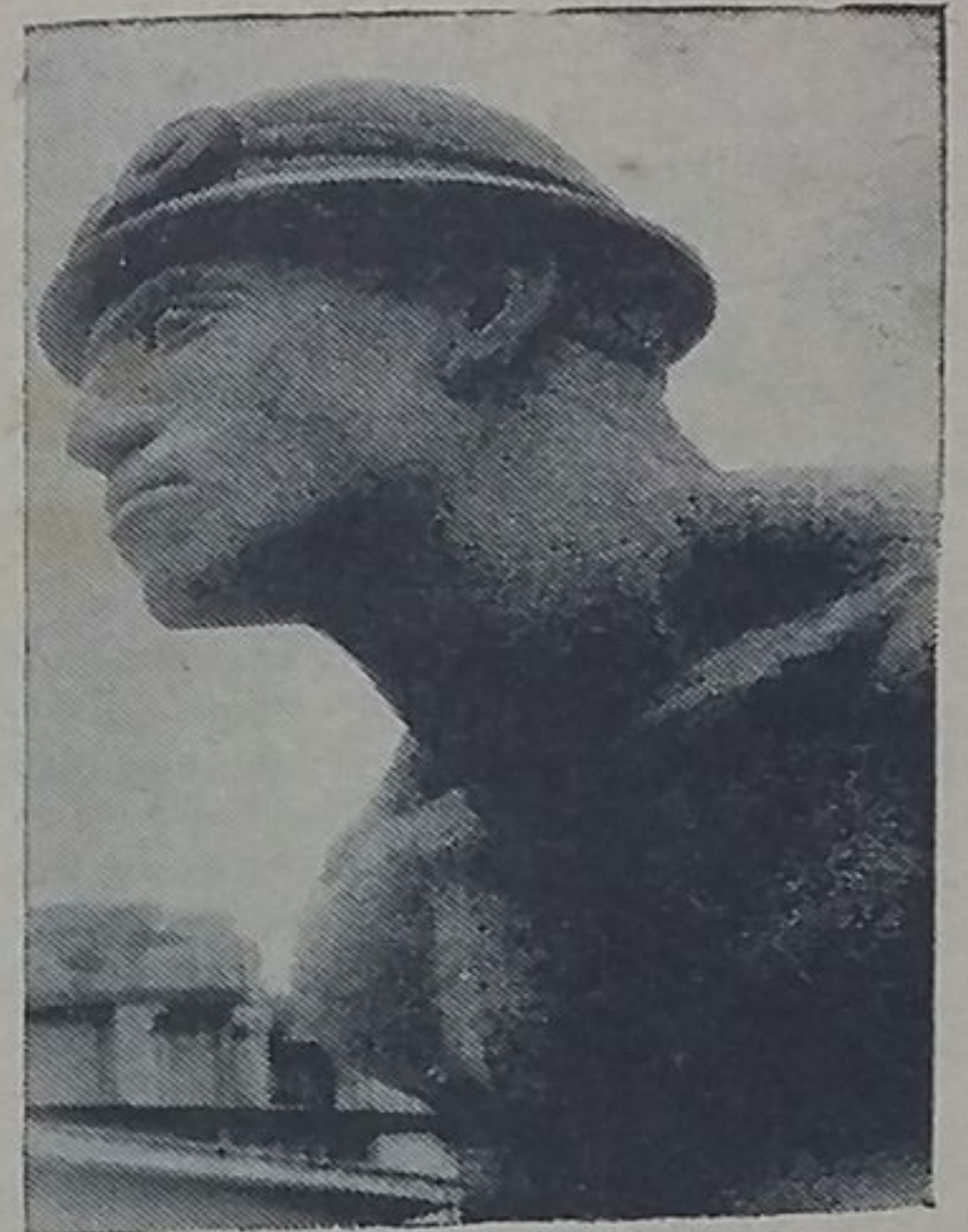
Detalle de El minero anónimo .

En 1946, la entonces Comisión Nacional de Irrigación organizó un concurso para premiar la mejor obra escultórica que conmemorara la inauguración de la presa de Valsequillo, en Puebla. Francisco Zúñiga obtuvo el primer lugar. Realizó un grupo de tres figuras que representan la Fecundidad, la Cosecha y el Trabajo, labrados en la famosa piedra chiluca, de color gris claro, con la cual se han levantado muchos monumentos de México (la catedral entre ellos). El grupo es gigantesco (las figuras tienen seis metros de alto) y está enclavado sobre una base piramidal que surge de una roca en eminencia. Sobre el paisaje del valle poblano, árido, bravío, cruzado por las aguas impetuosas del Atoyac, en aquellas tierras de color salmón donde hasta los árboles han desaparecido, emerge la escultura como una aparición milenaria, inundando los llanos y estremeciendo la soledad. Hay una incorporación al paisaje, porque a Zúñiga le interesan