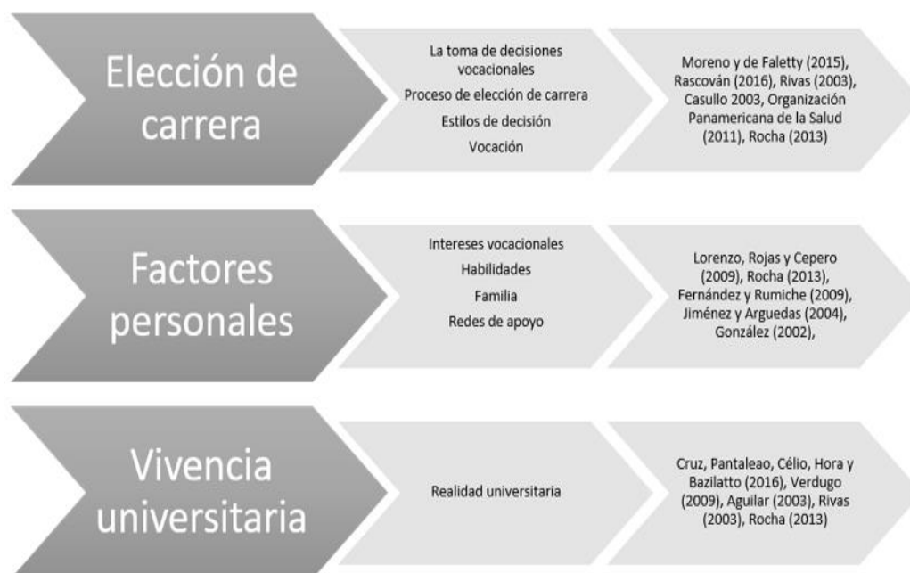
Figura 1. Elaboración personal.

Para la elaboración del marco referencial de la investigación se realizó un esquema como referencia conceptual para poder visualizar los temas claves y los autores que han contribuido a estos, y que son relevantes en este trabajo.