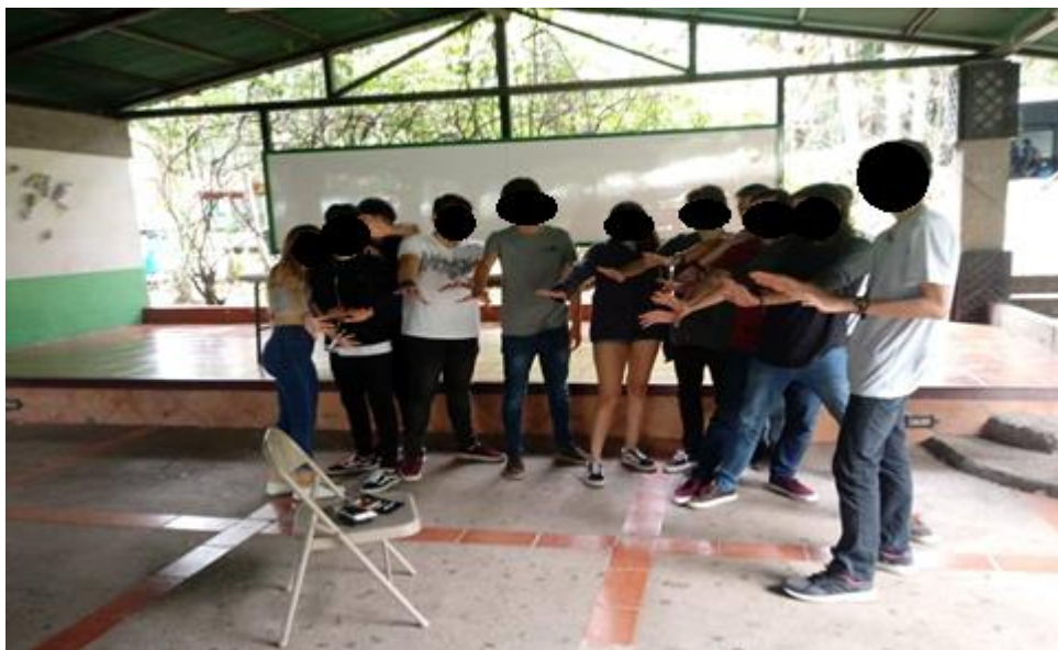
Imagen 1. Estudiantes realizando una escultura humana frente a sus teléfonos.

Varias personas participantes escogieron el tema de la distracción, realizando una escultura, la cual estaba conformada por algunos celulares del respectivo subgrupo acomodados en una silla, mientras este, de pie y en forma de media luna, “rechazaba” los celulares poniendo sus manos como barreras.