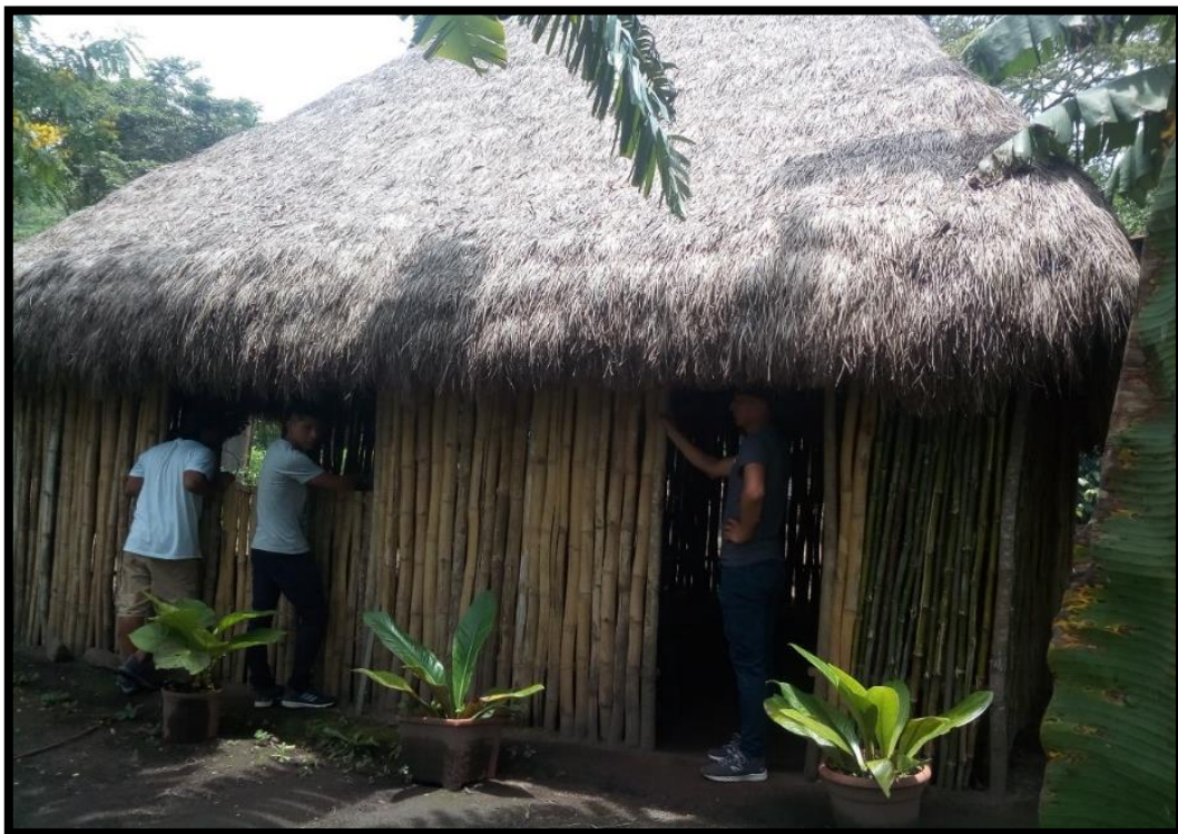
Ilustración 1: Centro de producción de artículos de uso tradicional.