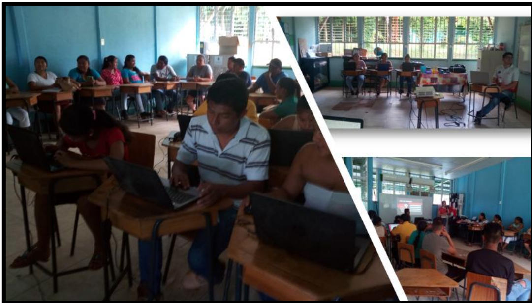
Ilustración 6. Talleres de computo. A la izquierda la primera sesión en la que se ubicaron las y los participantes en los grupos de “principiantes” (abajo a la derecha) y “avanzados” (arriba a la derecha).