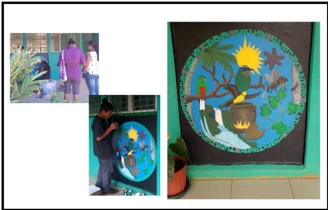
Ilustración 7. Proceso de creación del mural en una de las paredes de la Escuela de San Rafael de Cabagra.

El curso del taller de Cultura Bríbri también tuvo una segunda etapa, en este caso se abordaron algunos temas que habían quedado pendientes como la pintura y la talla en madera. Producto de esto, se pintó un mural en una de las paredes de la escuela, en la cual se representaron los 12 clanes bribris que ocupan este territorio.