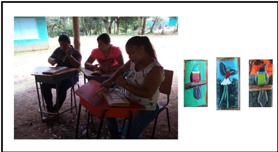
Ilustración 8. Proceso de talla de los clanes bribris que viven en el T.I. de Cabagra. Cada una de las participantes talla el clan al que pertenece.

Si bien, esta era una segunda etapa, dirigida a los participantes en el primer taller, finalmente no todos continuaron, aunque se integraron otros nuevos, por lo que fue necesario retomar algunos temas abordados anteriormente.