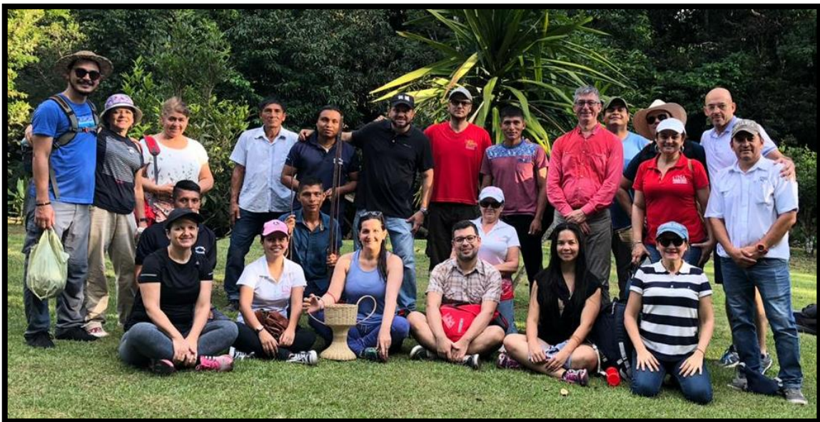
Ilustración 5. Grupo de participantes en la evaluación de la ruta, en Guanacaste de Ujarrás (26-11-2019).

Además, se elaboró un cuestionario para conocer su opinión sobre el recorrido y se les solicitó enviaran sus comentarios y recomendaciones, esta información servirá para retroalimentar la experiencia.