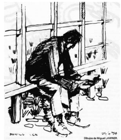
Dibujo de Miguel Lawner.

El ajedrez es un juego de mesa para dos personas, cada una con un “ejército” que debe derrotar al ejército contrario. En el juego debe haber destreza en el uso de las tácticas y, aunque no existe violencia física, sí se produce una violencia simbólica en la medida en que la meta es la eliminación de las piezas del contrario hasta conseguir el jaque mate al rey. El ajedrez es un juego reflexivo en el cual el azar no tiene cabida, salvo en la determinación del color de las piezas que utilizará cada jugador (las blancas comienzan). En este poema, la descripción de cada jugada se da con la