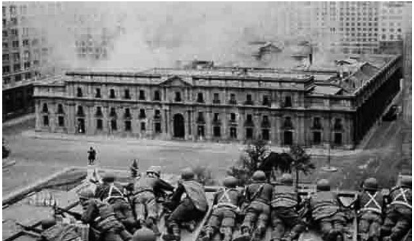
Palacio de La Moneda.

“¡Qui-Quiriquina! al alba de los gallos. Los interrogadores ¿a quién harán cantar con su piel de gallina? Y él les dirá qué pensando en quién cuando los gallos al alba: ¡qui-Quiriquina!”