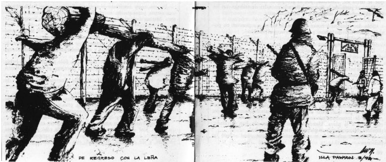
De regreso con la leña. Dibujo de Isla Dawson.

el proceso se utilizará la fuerza para quebrar al interrogado (lo harán cantar). Además, sabemos que la piel es el órgano corporal más maltratado en una sesión de tortura, lo que unido al miedo del prisionero, se conjuga en la “ piel de gallina ”. Los gallos en libertad abren y cierran el poema, la gallina queda encerrada en un espacio siniestro. Es la rutina diaria de la prisión.