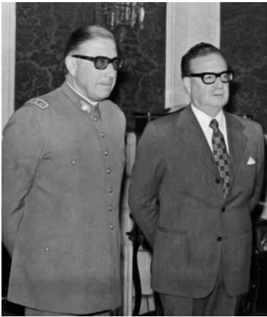
El gobierno socialista de Salvador Allende (1970- 1973).