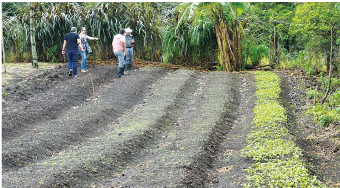
Figura 6. Académicos aprendiendo y compartiendo las experiencias con los agricultores de Aproagrín