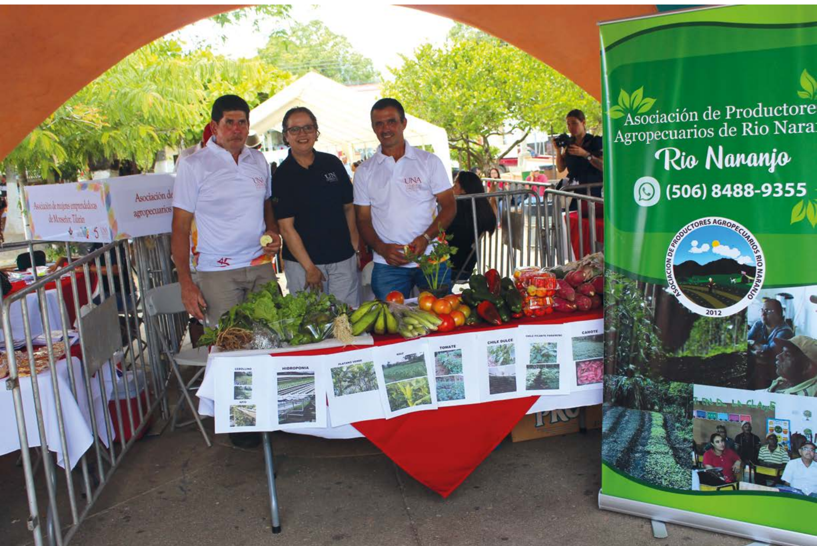
Figura 4. Participación de Aproagrín en feria comercial Santa Cruz, agosto 2018