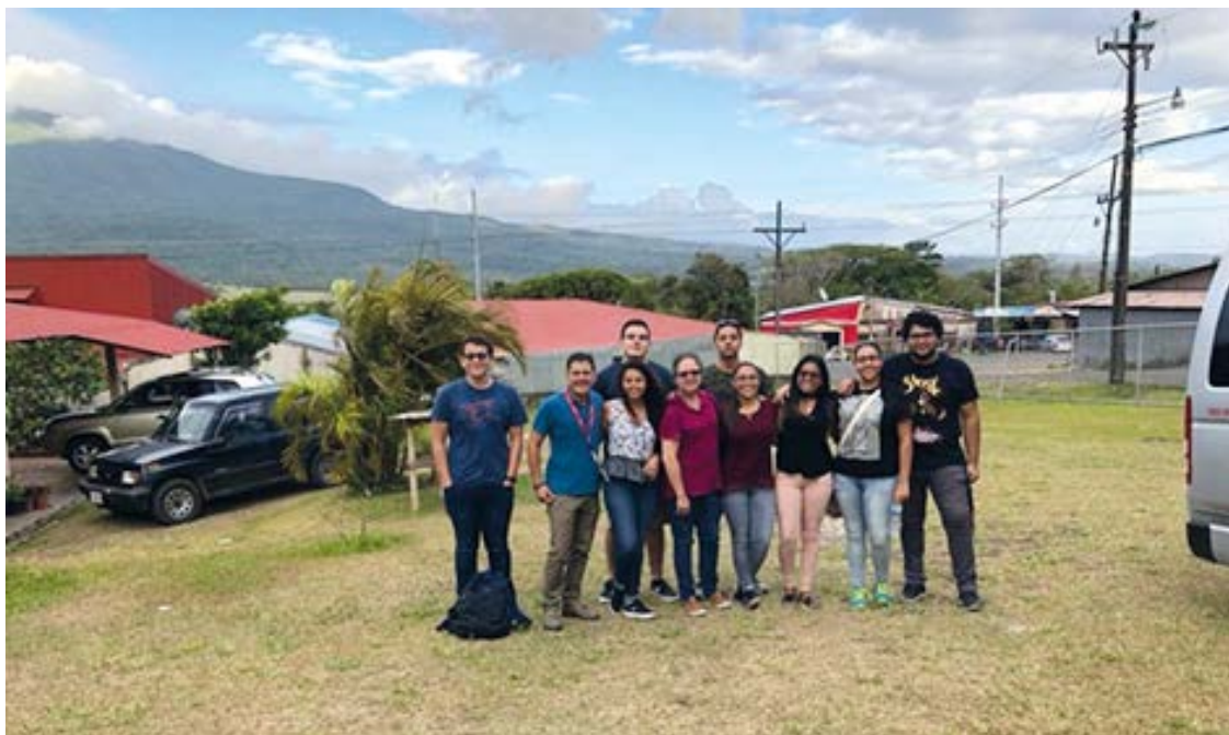
Figura 10. Estudiantes asistentes, proyecto Funder –Reunión taller con Aproagrín–

Nota: Fotografía propiedad de Proyecto Fortalecimiento de organizaciones rurales productoras de bienes y servicios para comercialización en los mercados locales: cuatro casos en la región Chorotega (Carrillo-Sánchez y Fonseca-Argüello, 2018-2020).