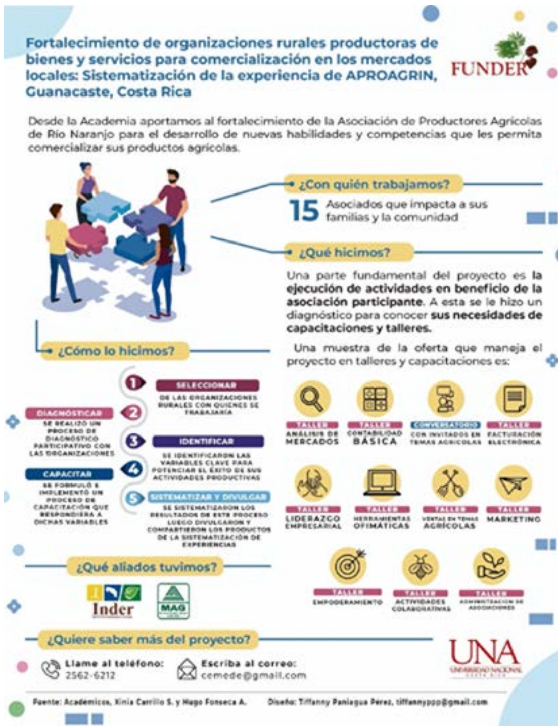
Figura Infografía: La historia del proceso de la experiencia

Fortalecimiento de organizaciones rurales productoras de bienes y servicios para comercialización en los mercados locales: Sistematización de la experiencia de Aproagrín, Guanacaste, Costa Rica