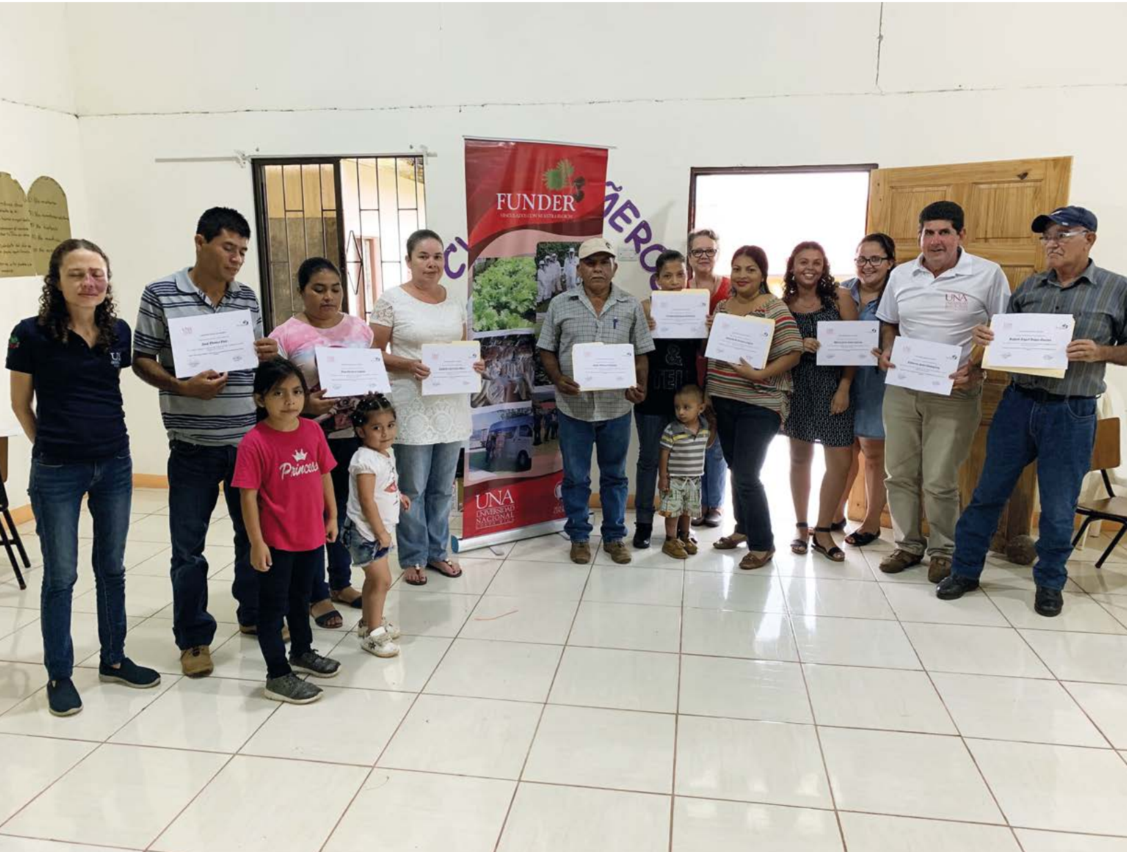
Figura 8. Taller de ofimática 2019