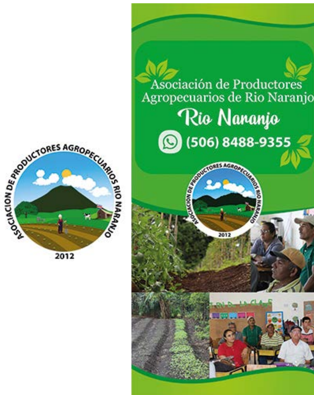
Figura 3. La identidad de Aprogrin como parte de su proceso integral

Fortalecimiento de organizaciones rurales productoras de bienes y servicios para comercialización en los mercados locales: Sistematización de la experiencia de Aprogrin, Guanacaste, Costa Rica