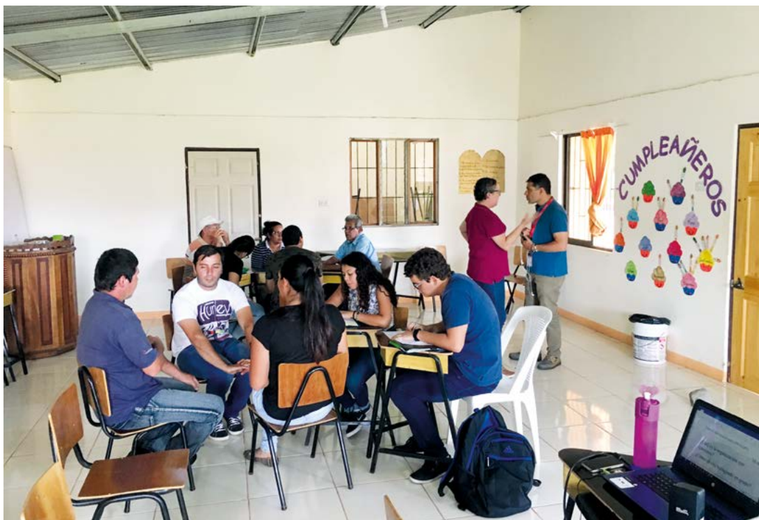
Figura 9. Estudiantes apoyando a Aproagrín

otros estudiantes que participaron de igual manera la convivencia fue excelente, a pesar de que era el único participante que venía de la zona de Heredia, me trataron muy bien y el trabajo conjunto fue muy bueno (ver figura 9).