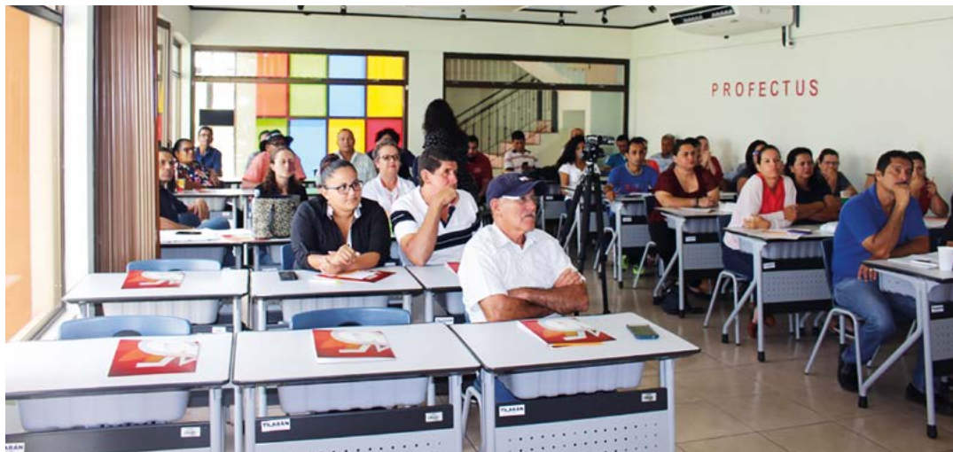
Figura 5. Taller de empoderamiento

Fortalecimiento de organizaciones rurales productoras de bienes y servicios para comercialización en los mercados locales: Sistematización de la experiencia de Aproagrín, Guanacaste, Costa Rica