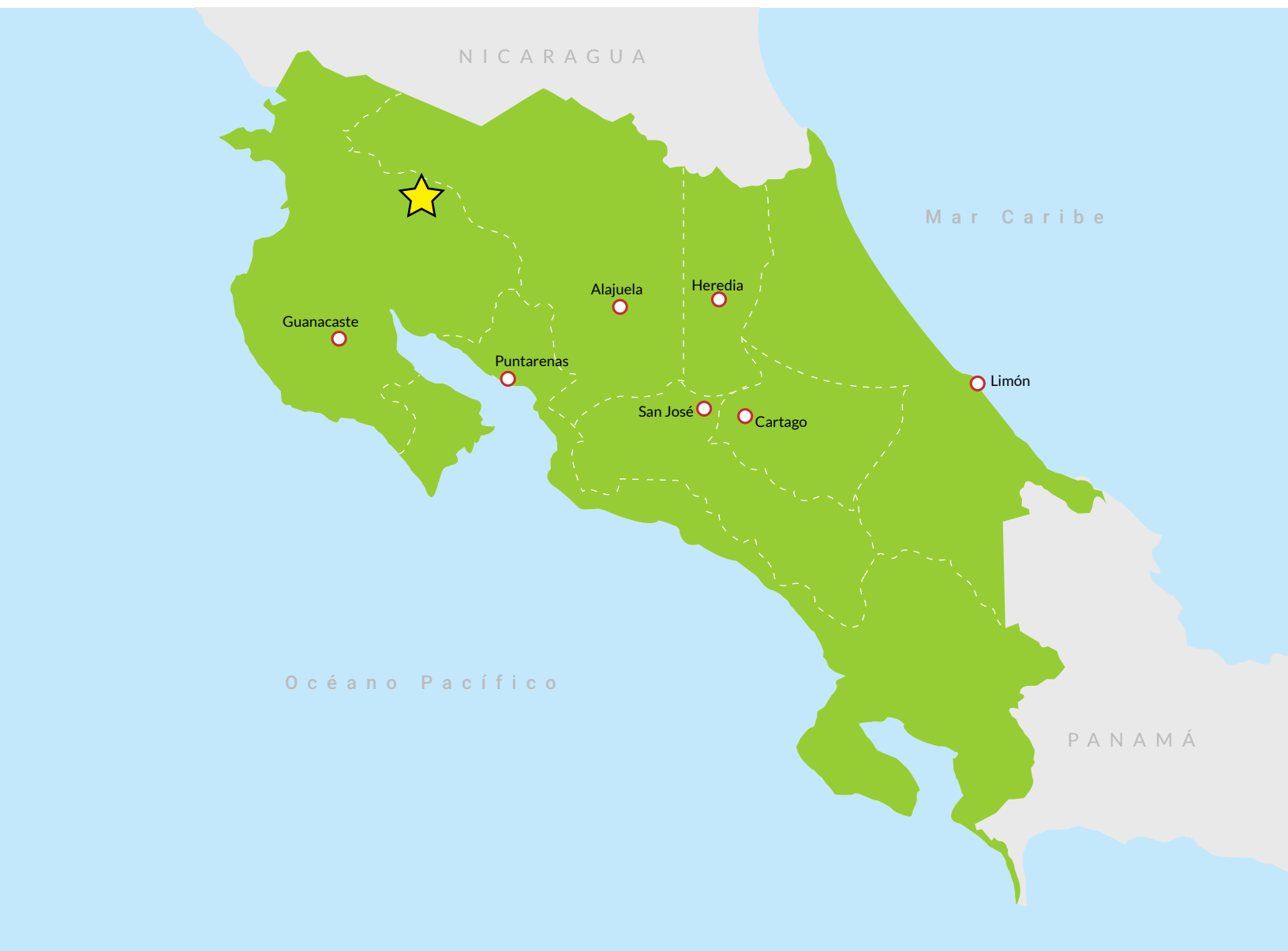
Figura 1. Ubicación en espacio y lugar Asociación de Productores Agropecuarios de Río Naranjo