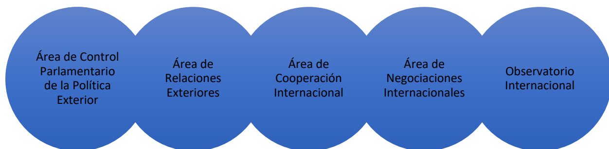
Figura N. 3 - Áreas estratégicas

El Centro abordará cinco áreas estratégicas, las cuales se detallarán a continuación: