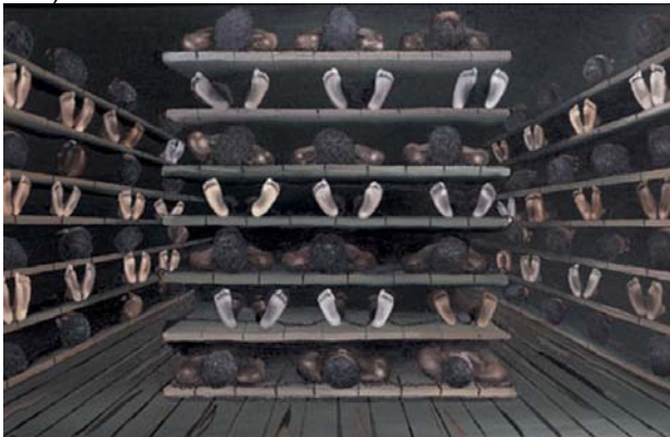
Figura 2: Las condiciones del pasaje Atlántico durante la trata de esclavos están entre las peores que registra la historia de la humanidad. Muchos millones de personas murieron durante este sombrío viaje (Tomado de la internet).

Todo lo anterior contradice la evidencia científica. De hecho, la población costarricense actual es el resultado de un proceso de mezcla trihíbrida, con proporciones globales de genes de origen europeo (61.04%), amerindio (29.91%) y africano (9.05%) (Morera et al. 2003) y la raíz africana también había caído en el olvido, hasta que la Historia, la Genealogía y la Genética hicieron posible revivir esta parte de nuestra historia poblacional (Meléndez Obando 2004).