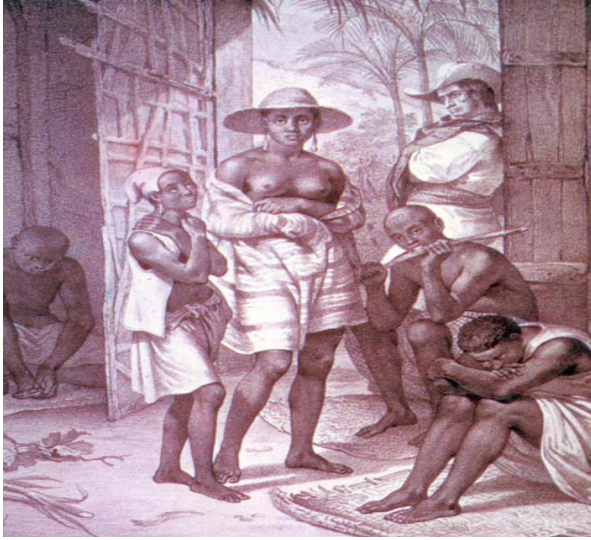
Figura 5. Las condiciones de esclavitud facilitaron que las mujeres africanas se mezclaran con sus amos europeos, como lo ha corroborado la genética de las poblaciones afroamericanas actuales (Tomado de Meléndez Obando 1997).

Como comentamos antes, de la costa de África Occidental el haplogrupo L2 pasó a América muchos siglos más tarde, y en el Nuevo Mundo se ha incorporado a las poblaciones afro-derivadas y mestizas (Figura 5). Curiosamente, aunque la influencia africana en la población costarricense ha sido bien documentada desde la época de la Colonia (Meléndez y Duncan 1989, Meléndez-Obando 1993, 1996, 1997, Morera et al. 1995, 2003), este caso representa una adquisición bastante reciente. O como dirían por ahí, “una fina especia importada”.