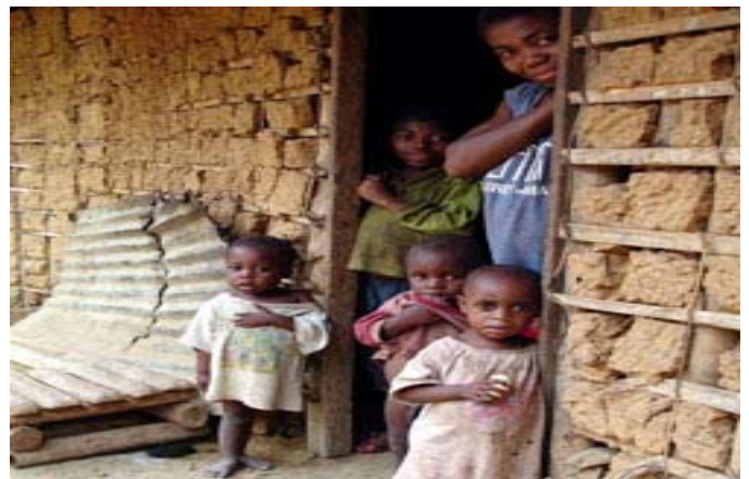
Figura 4. Como ilustración: una familia de Camerún. Entre los africanos actuales de la costa occidental viven muchas personas que portan el haplogrupo L2. Algunos poseen linajes mitocondriales próximos a los encontrados en los afroamericanos. Ellos son sus parientes en grado cierto por la línea materna estricta.