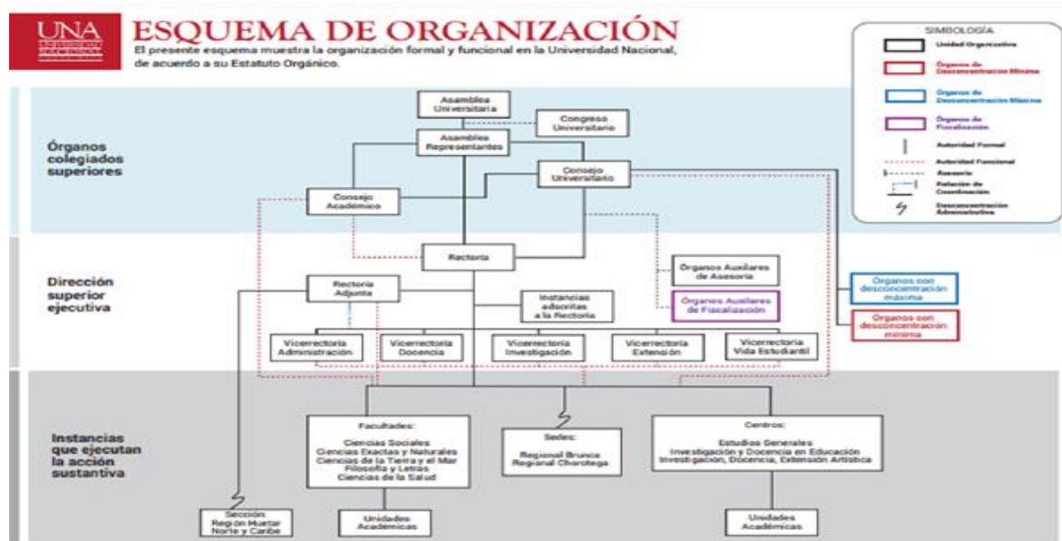
Figura 1 Estructura de la UNA

Como se muestra en la figura 1, la UNA está conformada por facultades y centros, estos a su vez, por unidades académicas. Los institutos forman parte de las unidades académicas. La UNA cuenta con ocho facultades que son Centro de Estudios Generales, Centro de Investigación y Docencia en Educación, Facultad de Ciencias de la Tierra y el Mar, Facultad de Ciencias Sociales, Centro de Investigación, Docencia y Extensión Artística y Facultad de Ciencias Exactas y Naturales.