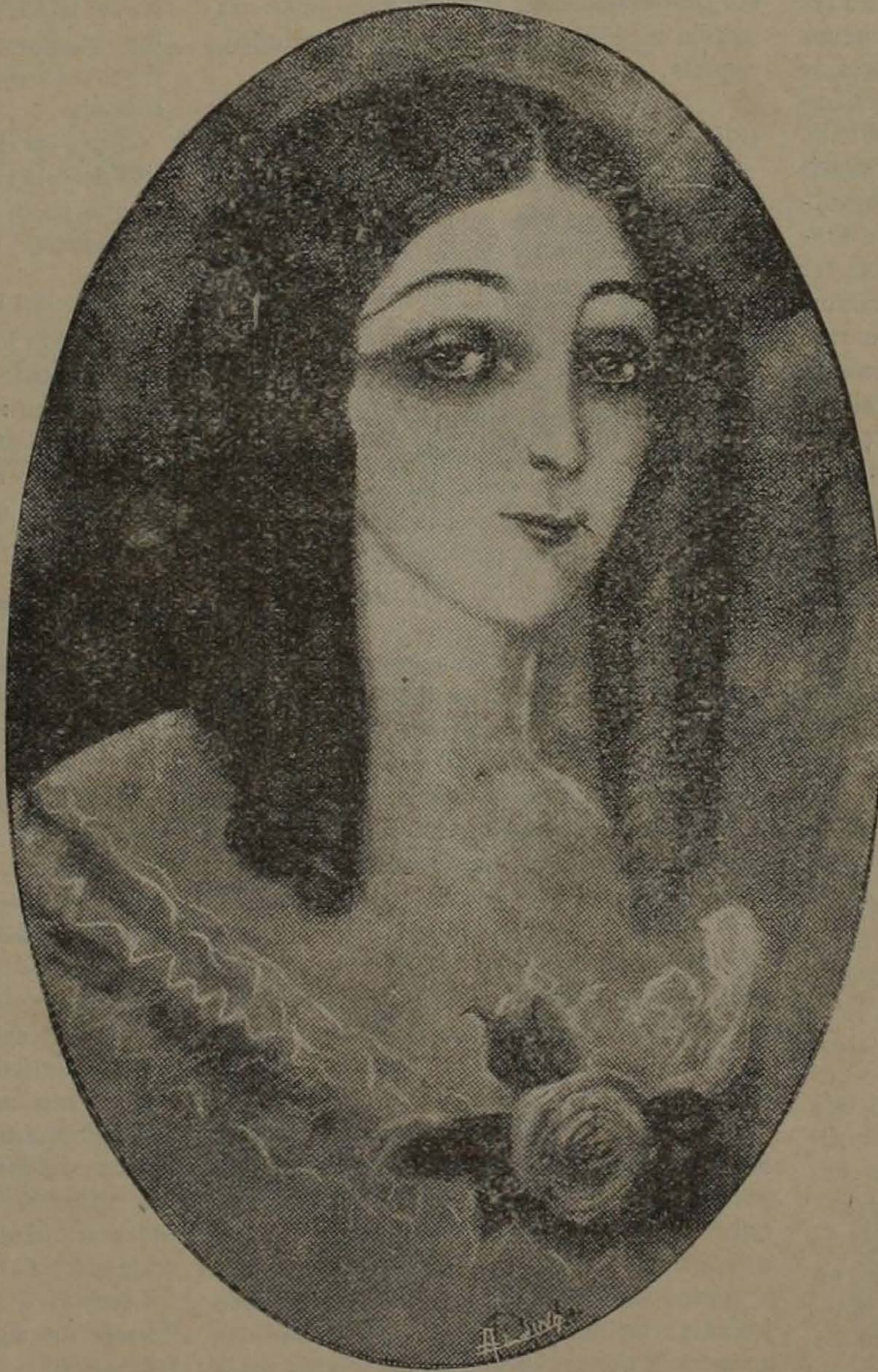
MARIA DUPLISSIS, «LA DAMA DE LAS CAMELIAS»

«Me parece que la veo todavía: grandes ojos negros, vivos, dulces, llenos de asombro, casi inquietos, y en los que se revelan