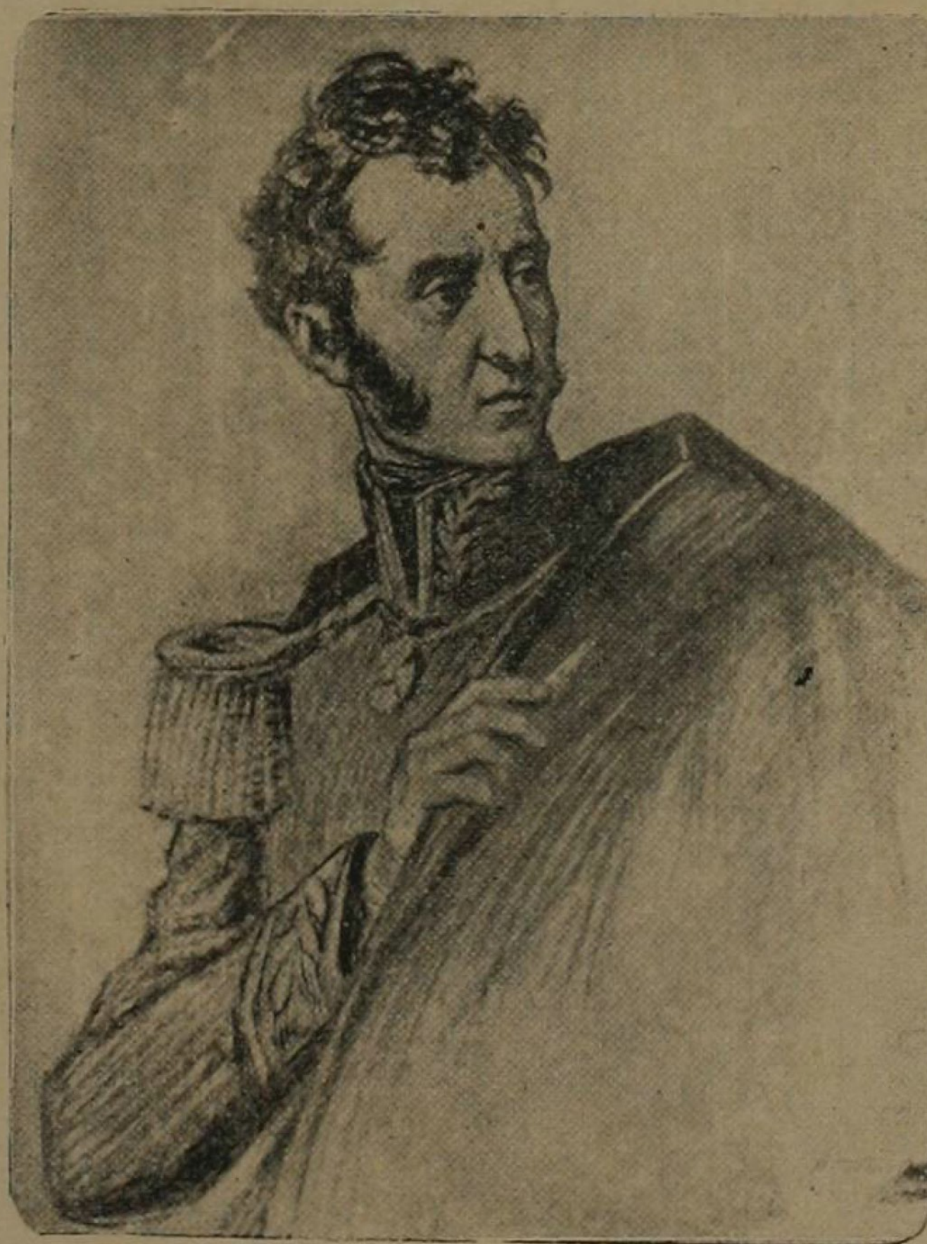
Antonio José de Sucre

= De Nuestra Tierra Prometida, San José, C. R. 1925. =