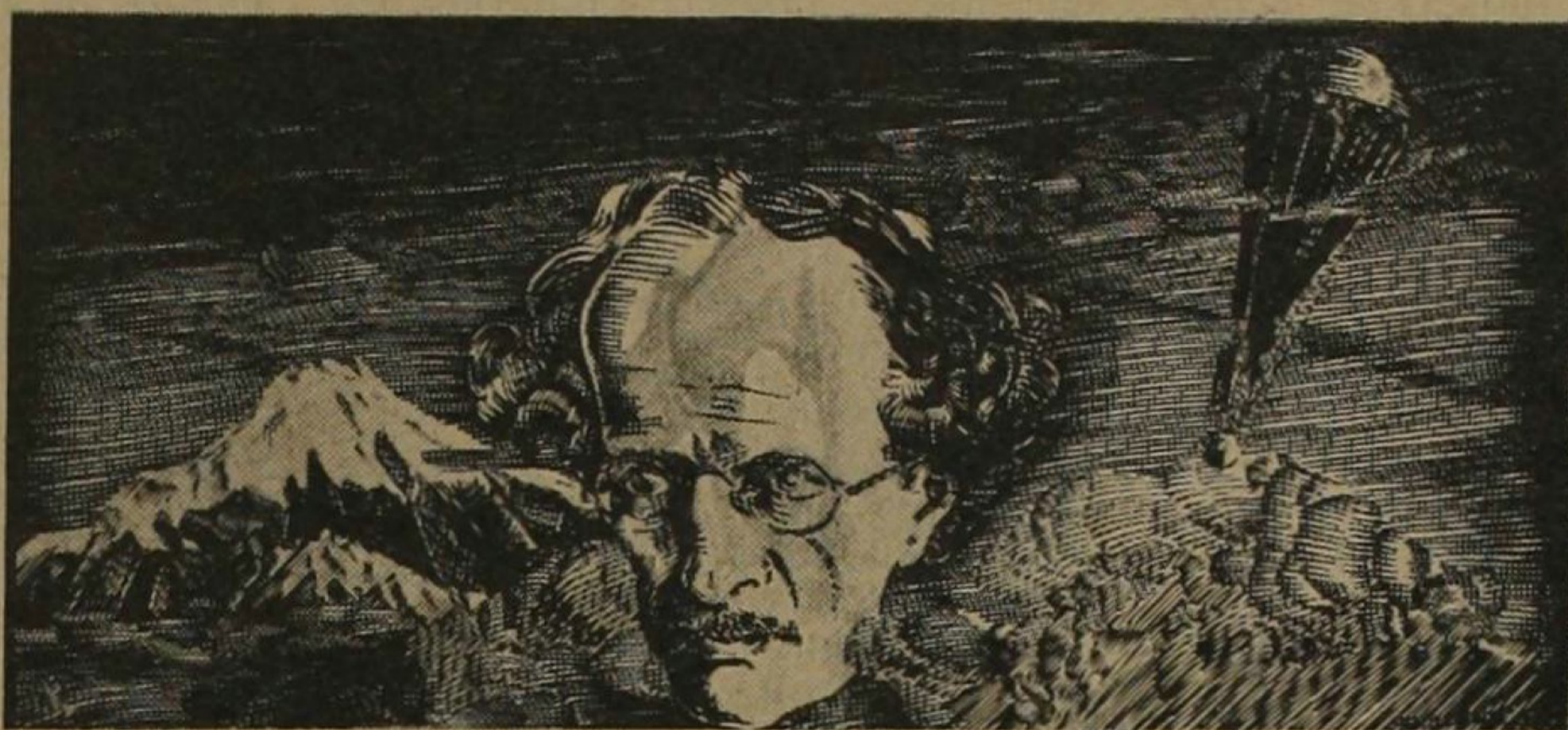
Dibujo de Luis Macaya.

Si he logrado éxito en la realización de mis planes, ha sido gracias a la competencia de mis colaboradores. En la sala de física de la Universidad de Bruselas habíanse efectuado ya, sin apreciables resultados, algunos experimentos con objeto de calcular el efecto de los rayos cósmicos que llegan a la Tierra; pero como la atmósfera terrestre es un obstáculo considerable para esta clase de rayos, me pareció que para obtener mejor resultado en dichas pruebas era necesario salir fuera de esta atmósfera.