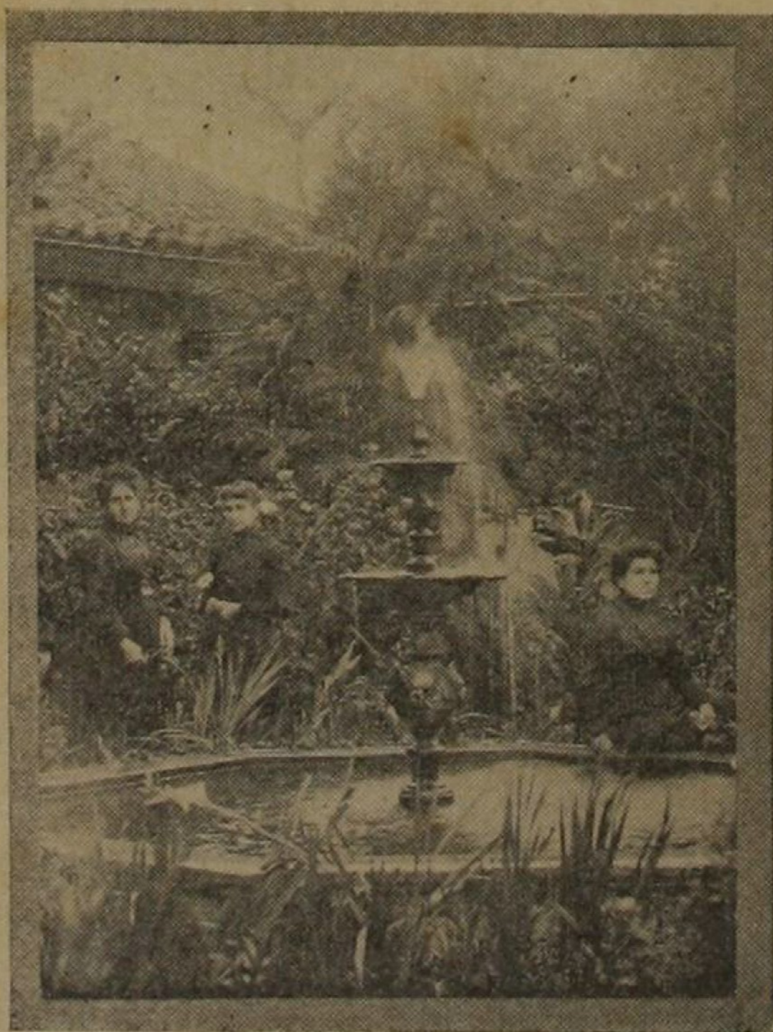
Interior de la casa de las señoras Espinach (Del Cartago de antes)

Algo he dicho ya de sus iglesias. También sus casas trascendían dignidad y hermosura. El terremoto y la destrucción sistemática que siguió al terremoto no dejaron nada en pie. Todo desapareció. Fuimos todavía más desafortunados que otras gentes que lograron salvar siquiera las ruinas, la Antigua y la Nueva Guatemala para no ir muy lejos. En Cartago se cumplió el verso de Lucano: "Etiam periere ruinae" (Hasta las ruinas perecieron), y todavía sobre la ira del volcán y sobre el afán destructor de los hombres hemos tenido que sufrir también la incomprensión aplaudidora de aquella obra nefasta. Léase sino lo que decía La Información el 4 de mayo de 1913: "La Cartago nueva no tiene el aspecto triste y pesado de aquella Cartago que fué cuna del país, y que el terremoto redujo a escombros, redujo a polvo, redujo a nada...; la Cartago nueva es una ciudad coqueta, bonita como sus valles, como sus florestas, con sus flores y con sus mujeres".