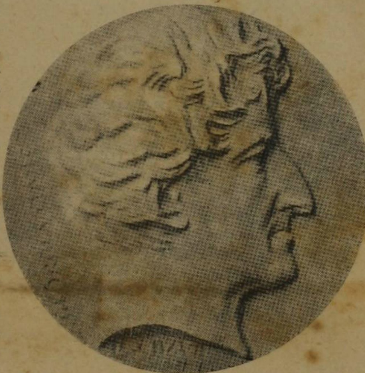
Georges Cuvier (1769-1832)

Termina el colegio. Los progenitores son pobres; no disponen de recursos para enviarlo a perfeccionarse fuera del