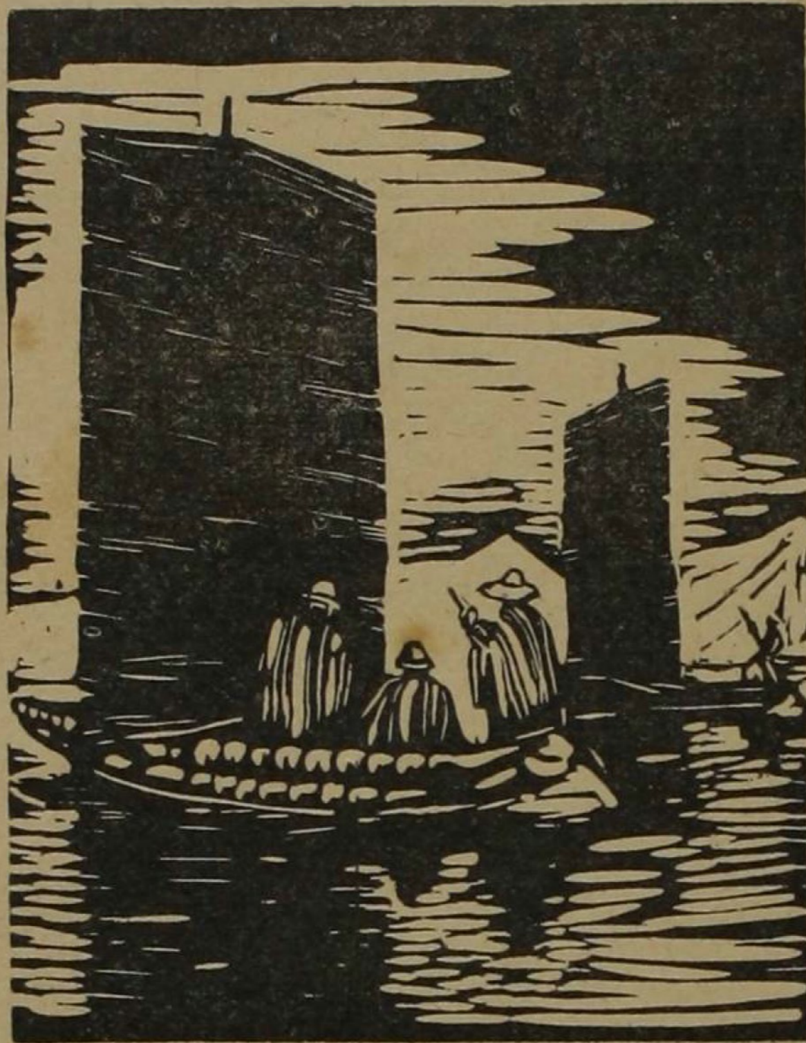
Barcas en el Lago Titicaca