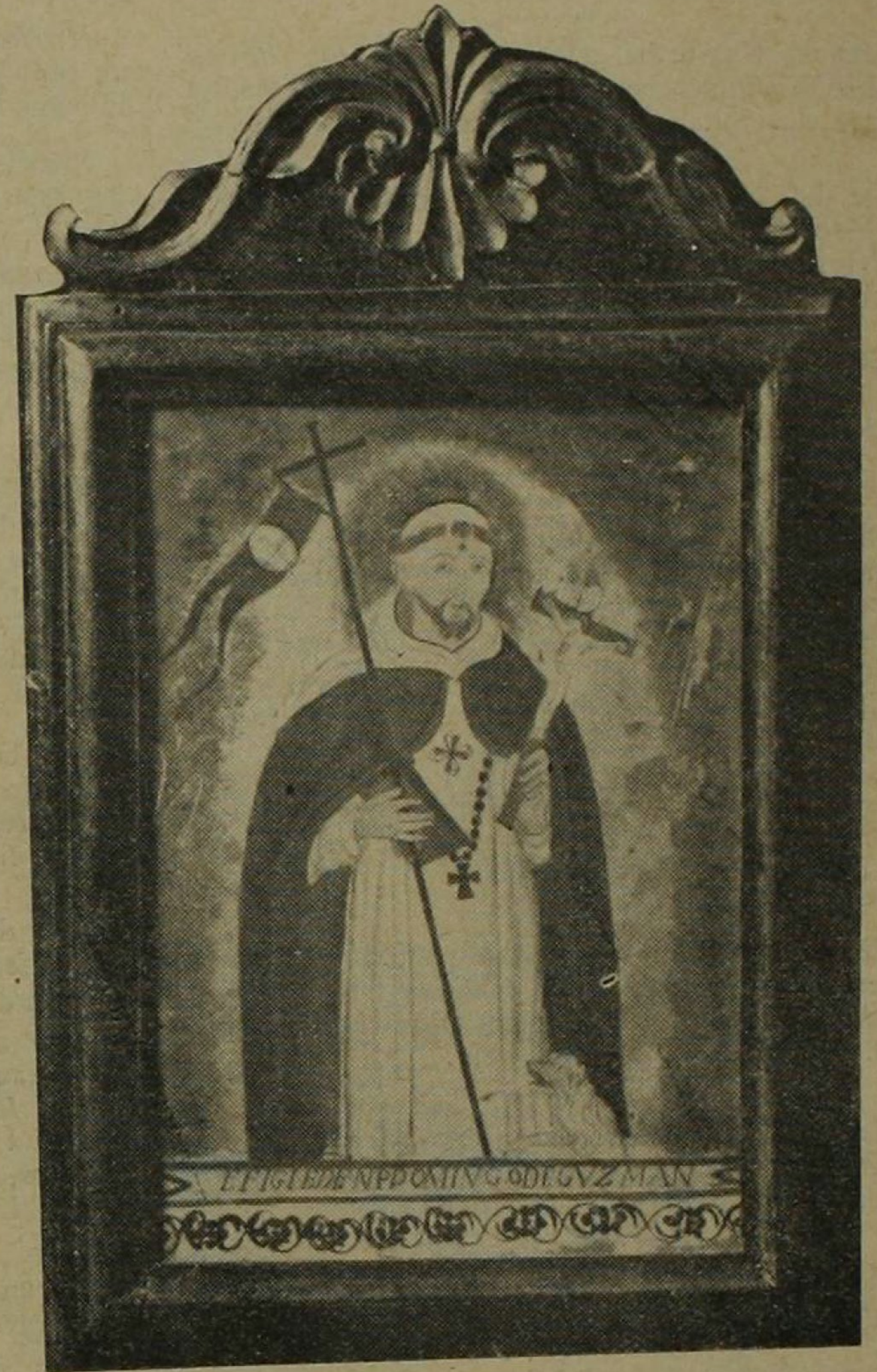
Santo Domingo de Guzmán

Retrato pintado por Rosales. (De la colección de don Fernando Yglesias).