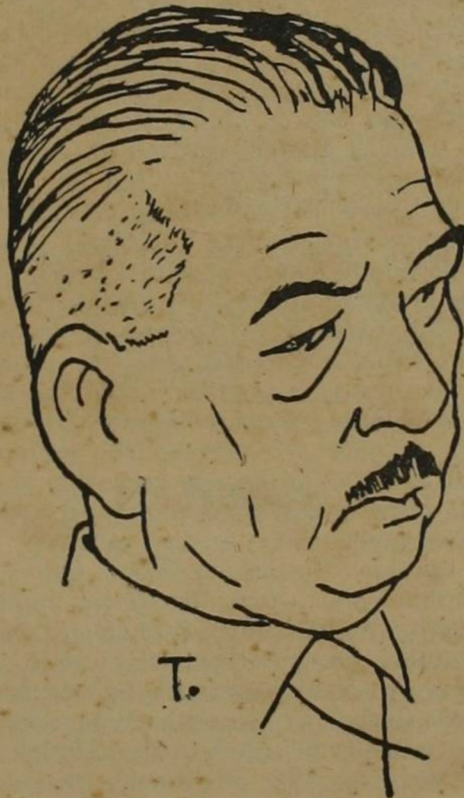
Pedro Henríquez Ureña

(Es un recorte de La Nación , Bs. Aires, marzo 29 de 1953. Envío del autor).