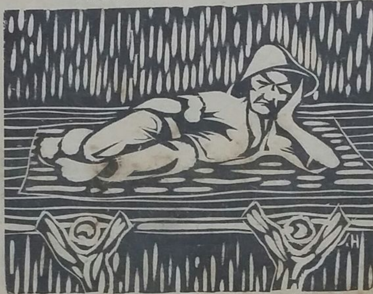
Ilustración del Autor

= Envío del autor.—Costa Rica y enero del 35 =