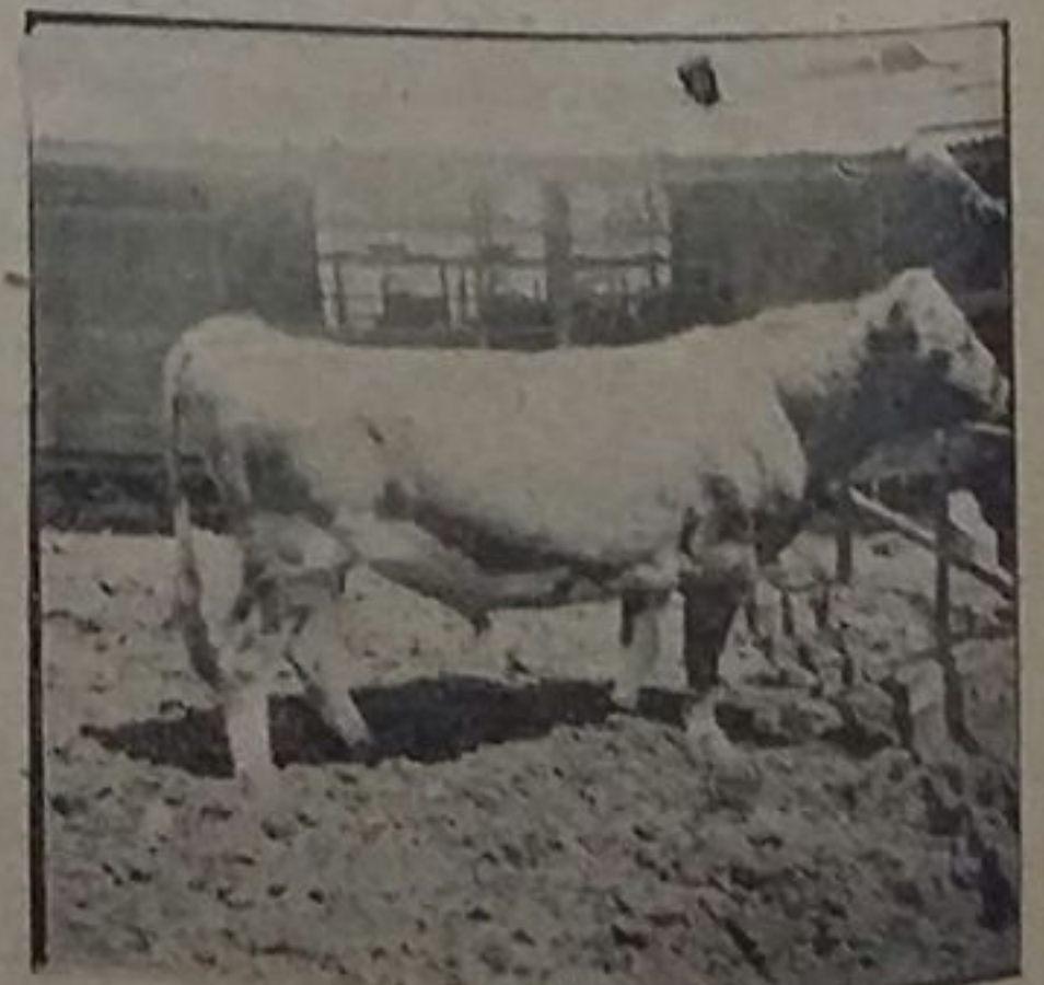
SIR INKA MAY VALENTINE

No debe olvidarse que este ható está inmune a la fiebre de garrapatas.