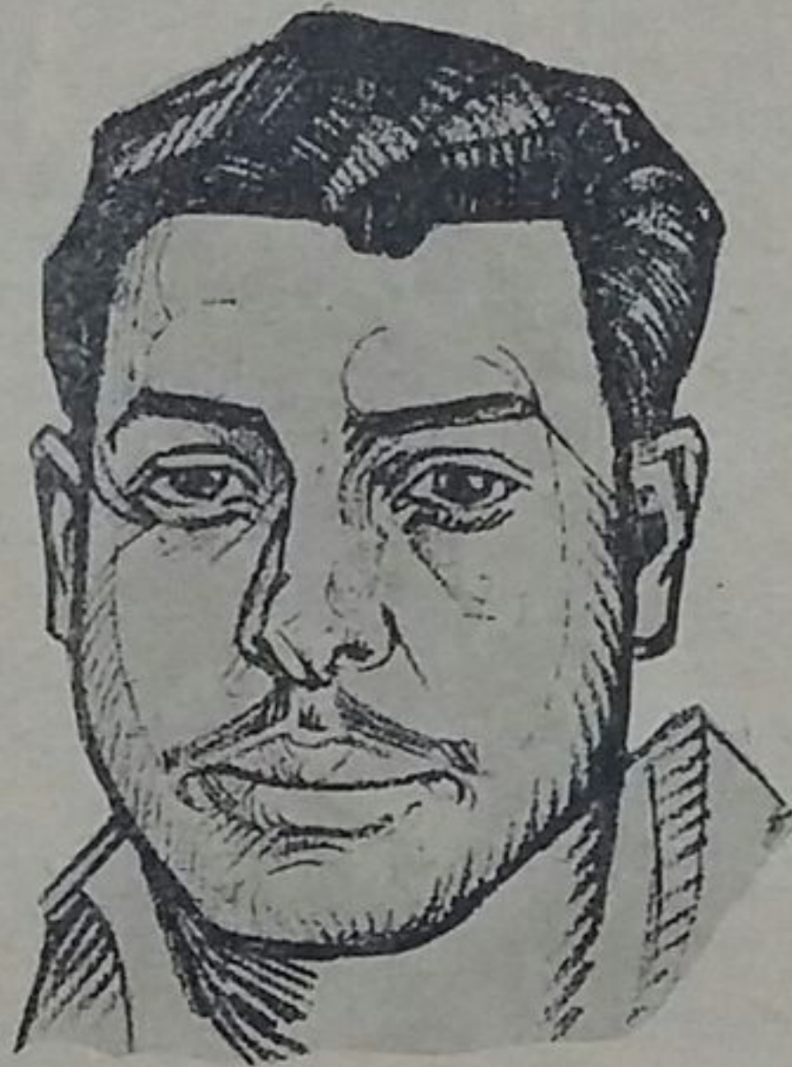
Ramón López Velarde

Nada había en sus palabras que desconcertara. Ningún brillo. Ningún deseo de brillar. Palabras lentas que buscaban su sitio en la frase que a veces moría, cuando Ramón López Velarde juzgaba que ya no era indispensable que siguiera viviendo, aun antes de terminar. Si había algo desconcertante en