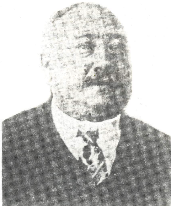
DON CARLOS GAGINI

Por esos años, Costa Rica, E.E. U.U. y México, se habían convertido, por razones distintas en cada caso, en fuerzas de oposición a las cruzadas centroamericanistas de los regímenes liberales.