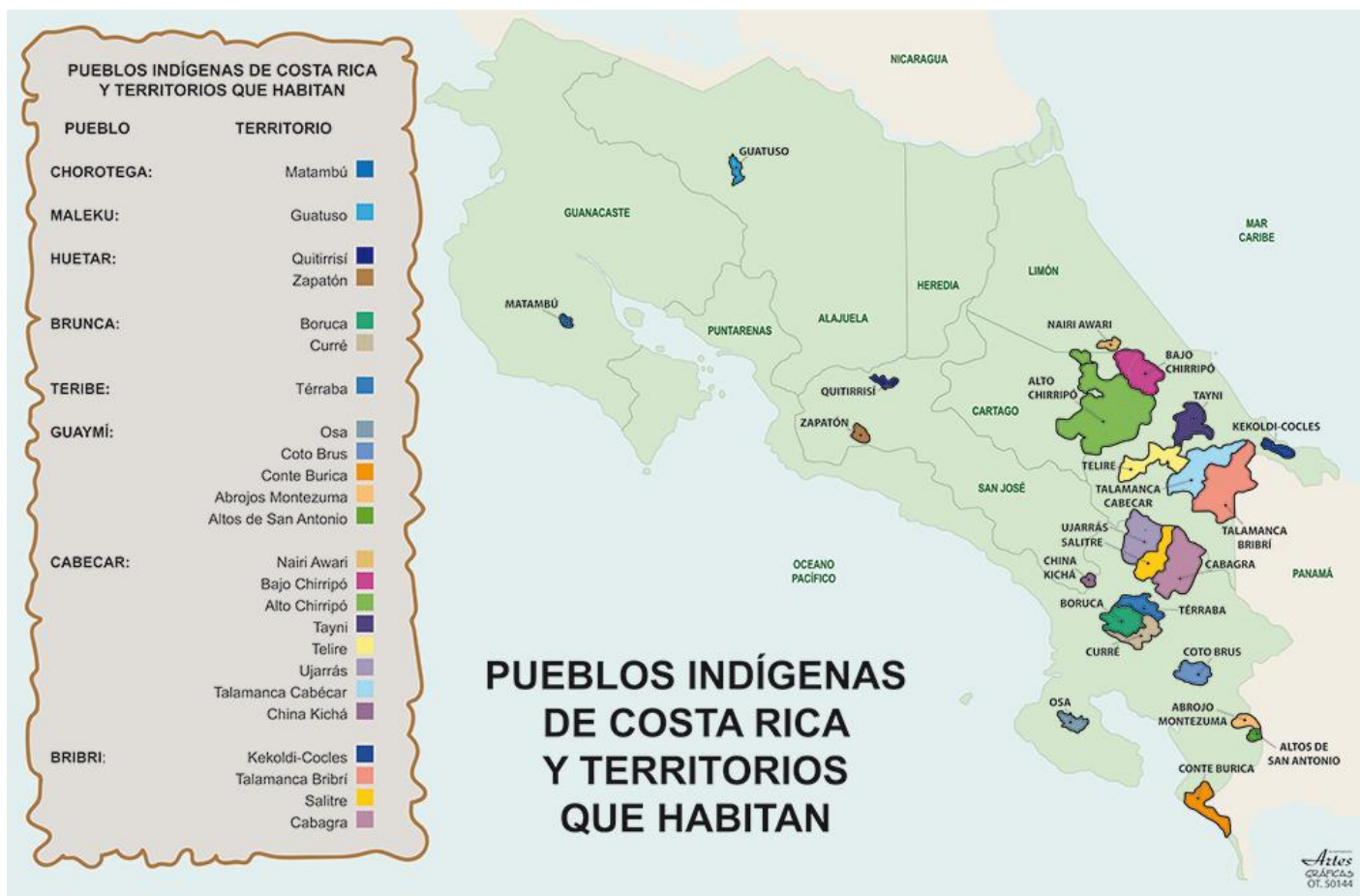
Figura 1. Mapa de pueblos indígenas de Costa Rica