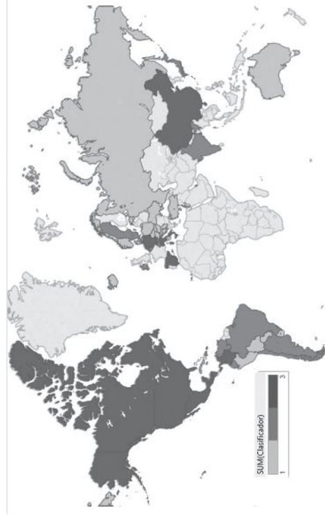
Ilustración 1 Países donde Costa Rica tiene representación diplomática según el índice de comercio internacional

El siguiente mapa muestra los países donde Costa Rica posee una representación diplomática según el índice de comercio internacional elaborado. El color oscuro representa los países donde hay un fuerte intercambio comercial, en este caso el índice es mayor a 0.03 (en el cuadro 2 estas naciones están enumeradas del 1 al 15). El color claro representan los estados con un comercio similar a la media, el valor del índice oscila entre 0.01 y 0.03 (los territorios enumerados en el cuadro 2 desde el 16 hasta el 30). Por último, el verde más claro representa un escaso o nulo comercio entre Costa Rica y los países enumerados en el cuadro 2 desde el 31 y hasta el 68, el indicador se encuentra entre 0 y 0.01. Las regiones en blanco no cuentan con embajadas o consulados de Costa Rica.