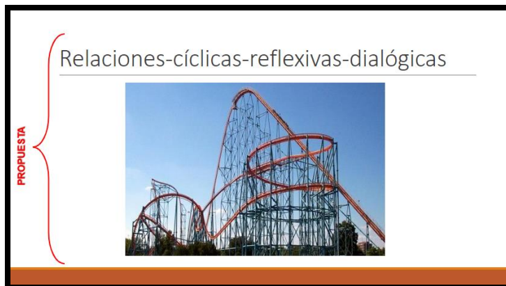
Figura 2. Dispositivo de FODA para motivación al diálogo