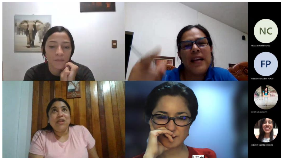
Figura 4. Captura de pantalla de círculo/taller en presencialidad remota (26 de octubre del 2021)

La nueva coordinación de la comisión también busca dar continuidad al uso de esto círculos de discusión para la profundización en aspectos metodológicos, pero ahora, más allá de las líneas centrales de la investigación-acción enfatizadas en los años previos. Así, un importante círculo/taller se realiza el segundo semestre (26 de octubre, Ver Figura 4) con varias tutoras de seminario y estudiantes para profundizar y desarrollar ejercicios de profundización en la metodología del análisis multimodal de la interacción (específicamente para la investigación de la co-creación pedagógica en ambientes de aprendizaje) (Ver lista de participación y muestra de insumos utilizados en Anexo 5, sección B). El resultado de la actividad condujo a la adopción de esta metodología por parte de algunos TFG, por lo cual se estimó la estrategia como exitosa y se valora la continuidad de círculos/talleres similares, centrados en metodologías específicas, para las fases futuras del accionar de la comisión. Por último, nuevamente dando continuidad a lo realizado por la CTFG en años anteriores, además de las actividades descritas, durante el 2021 se realizaron más de 5 sesiones de diálogo reducidas con equipo específicos de TFG (como ya se mencionó, la celebración de estas sesiones reducidas se evidencia en el informe final del proyecto 0397-15, como un incremento en las sesiones de trabajo dentro del indicador 1.4 entre 2018 y 2021).