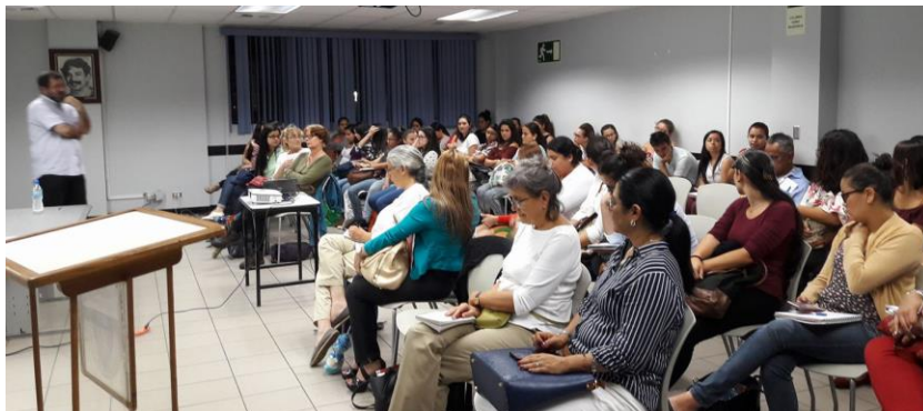
Figura 3. Círculo abierto de discusión con pasantes (20 de setiembre)