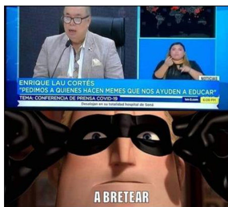
Imagen 10. «Ayuden a educar» 36

Nora: tomado de shitposterscr, 22 de marzo de 2020. El título lo asigné yo.