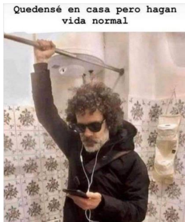
Imagen 8. «Vida normal»

Nota: tomado de: shitposterscr, 17 de marzo de 2020. El título lo asigné yo.