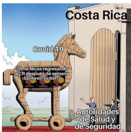
Imagen 13. «Caballo de Nicaragua»

Nota: tomado de la_chayotera.cr, 12 de abril de 2020. El título lo asigné yo.