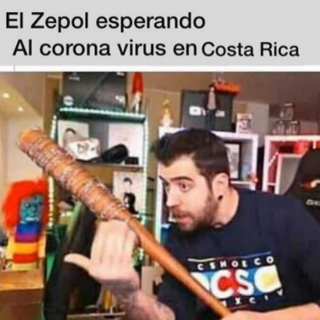
Imagen 4. «Defensa con un bate»

Nota: tomado de abstrac_memes , 01 de marzo de 2020. El título la asigné yo.