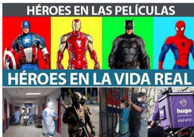
Imagen 23. «Héroes de la vida real»

Nota: tomado de noseasmajesv, 09 de abril de 2020. El título lo asigné yo.