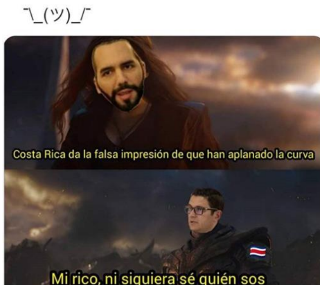
Imagen 14. «Ni siquiera sé quién sos»

Nota: tomado de la_chayotera.cr, 06 de mayo de 2020. El título lo asigné yo.