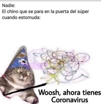
Imagen 1. «El chino que estornuda»

El título la asigné yo.