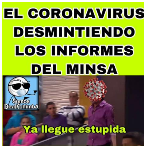
Imagen 39. «Ya llegué»

El título lo asigné yo.