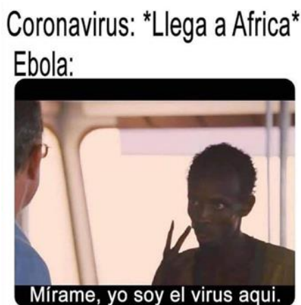
Imagen 3. «COVID-19 contra el ébola»

Nota: tomado de: abstrac_memes, 05 de febrero de 2020. El título la asigné yo.