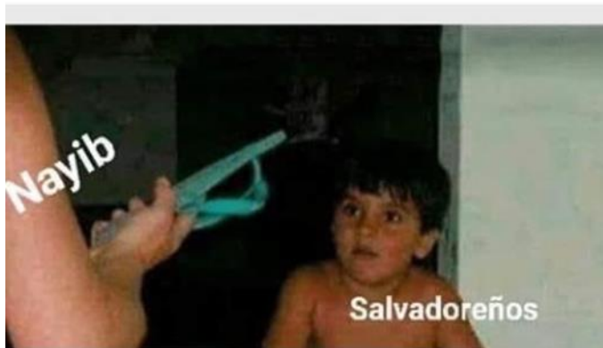
Imagen 22. «Hagan caso»

Nota: tomado de noseasmajesv, 07 de abril de 2020. El título se tomó de la descripción de la publicación.