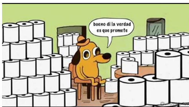
Imagen 7. «El perro y el papel higiénico»

Nota: El título lo asigné yo.