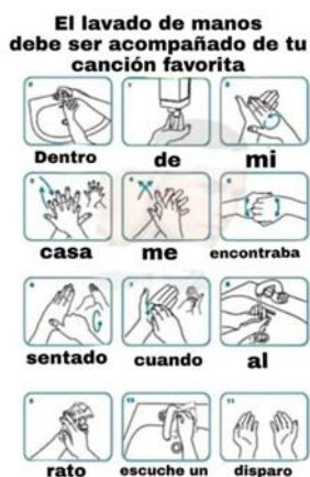
Imagen 34. «Todxs contra el Corona virus» 112

Nota: Tomado de Chocoturca posteo vol. 1, 15 de marzo de 2020. El título se tomó de la descripción de la publicación.