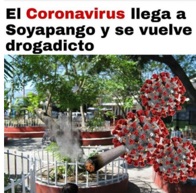
Imagen 16. «Coronavirus drogadicto»

El título lo asigné yo.