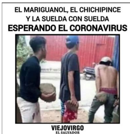
Imagen 17. «Esperando al Coronavirus»

Nota: tomado de viejovirgosv, 28 de febrero de 2020. El título lo asigné yo.