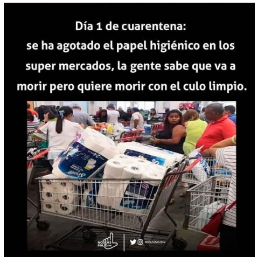
Imagen 20. «Se ha agotado el papel»

Nota: tomado de noseasmajesv, 12 de marzo de 2020B. El título lo asigné yo.