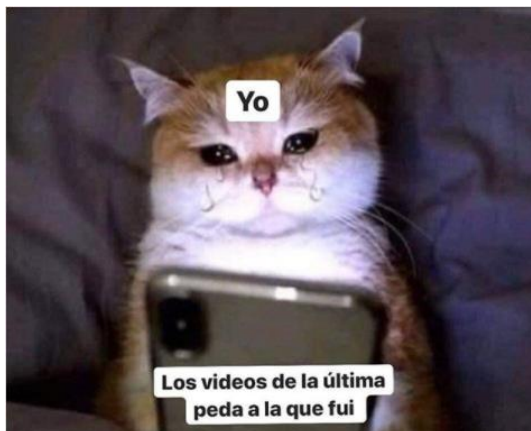
Imagen 11. «Gato llorando»

Nota: tomado de la_chayotera.cr, 03 de abril de 2020. El título lo asigné yo.