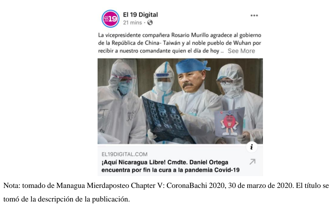
Imagen 33. «Allí está el hombre»

Nota: tomado de Managua Mierdaposteo Chapter V: CoronaBachi 2020, 30 de marzo de 2020. El título se tomó de la descripción de la publicación.