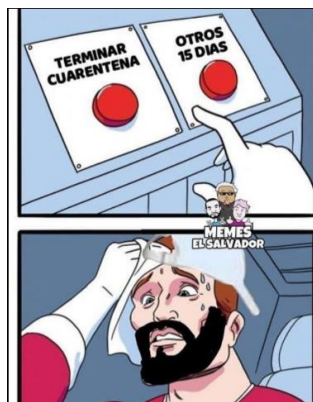
Imagen 28. «Otros 15 días»

Nota: toma de memeselsalvador, 04 de junio de 2020. El título lo asigné yo.