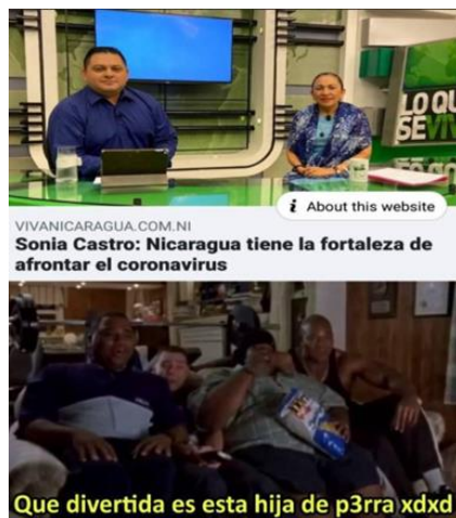
Imagen 32. «Qué divertida»

Nota: tomado de Memes Universitarios Nicas, 10 de febrero de 2020. El título lo asigné yo.