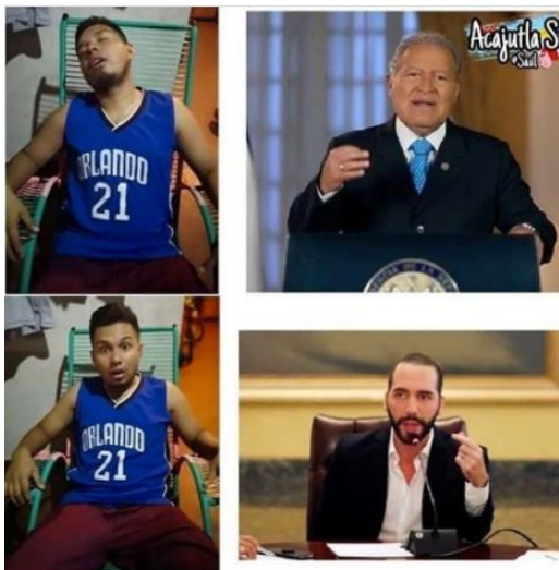
Imagen 21. «Sánchez no; Bukele, sí»

Nota: tomado de noseasmajesv, 21 de marzo de 2020. El título lo asigné yo