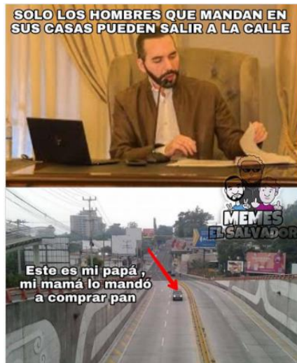
Imagen 27. «Los hombres mandan en la casa»

Nota: tomado de memeselsalvador, 09 de mayo de 2020. El título lo asigné yo.