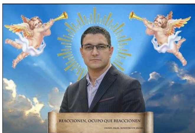
Imagen 9. «Ocupo que reaccionen»

Nota: tomada de shitposterscr, 18 de marzo de 2020. El título lo asigné yo.