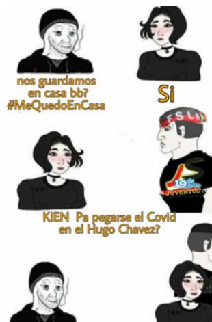
Imagen 35. «¿Quién para pegarse la COVID-19?» 118

Nota: tomado de Managua Mierdaposteo Chapter V: CoronaBachi 2020 (27 de marzo de 2020). El título lo asigné yo.