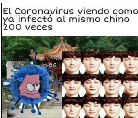
Imagen 2. «El virus molesto»

El título la asigné yo.