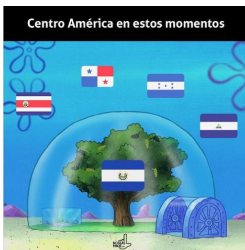
Imagen 18. «El Salvador dando cátedra»

Nota: tomado de noseasmajevs, 11 de marzo de 2020. El título se tomó de la descripción de la publicación.