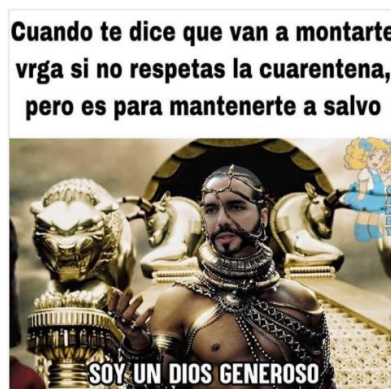
Imagen 25. «Un dios generoso»

Nota: tomado de memeselsalvador, 07 de abril de 2020. El título lo asigné yo.