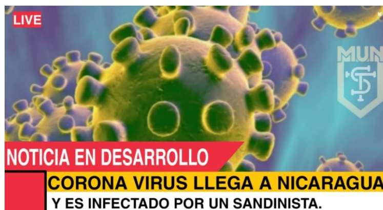
Imagen 31. «Coronavirus llega a Nicaragua»

Nota: tomado de Memes Universitarios Nicas, 28 de febrero de 2020. El título lo asigné yo.