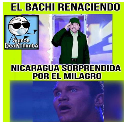
Imagen 37. «Bachi renaciendo» 125

Nota: tomado de nicas_deakachimba_oficial, 15 de abril de 2020. El título lo asigné yo