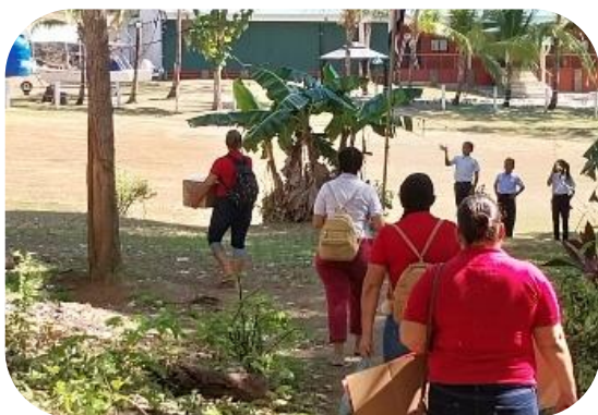
Estudiantes del equipo de producción visitan las escuelas.