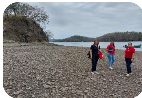
Estudiantes y profesora de la Universidad Nacional conociendo el contexto de las escuelas.