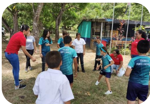
Estudiantes de Lepanto y Guatuso realizando actividades en las escuelas.