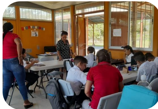
Estudiantes de la Universidad Nacional apoyan a la docente de la Escuela Santa Cecilia.