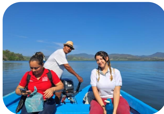
Estudiantes del equipo de producción visitan las escuelas