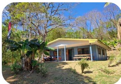
Escuela Isla Cedros.