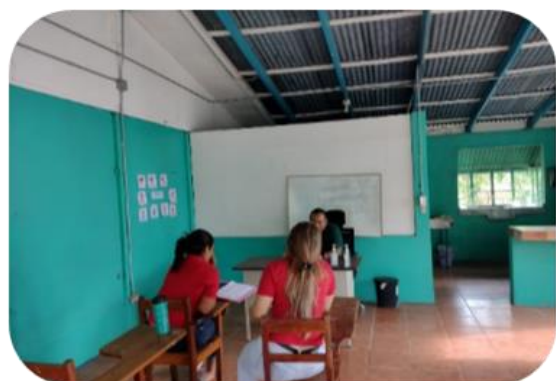
Estudiantes de la Universidad Nacional realizan entrevista al docente de Escuela Punta del Río