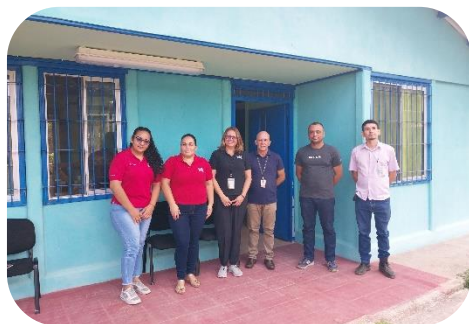
Estudiantes y profesora de la Universidad Nacional visitan la Supervisión de Paquera.