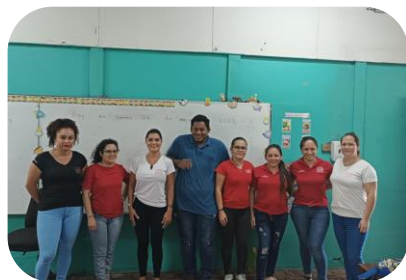
Estudiantes de Lepanto y Guatuso visitan Escuela Punta del Río.