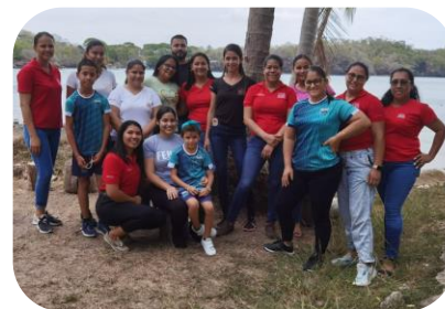
Estudiantes de Lepanto y Guatuso visitan Escuela Punta Cuchillo.