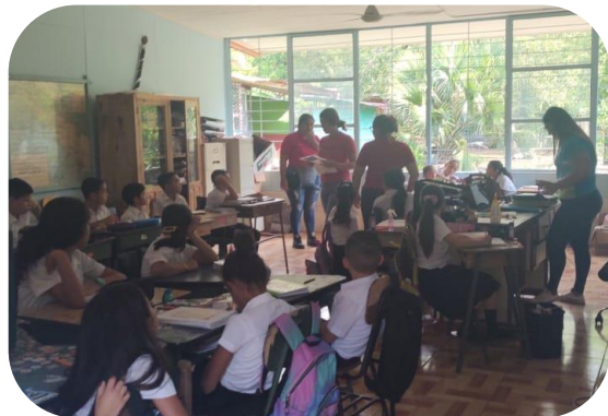
Estudiantes de la Universidad Nacional apoyan a la docente de la Escuela Concepción