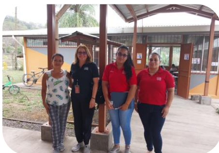
Estudiantes y profesora de la Universidad Nacional visitan escuelas del circuito 01.