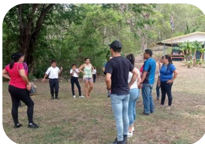
Estudiantes de Lepanto y Guatuso visitan Escuela Isla Cedros.