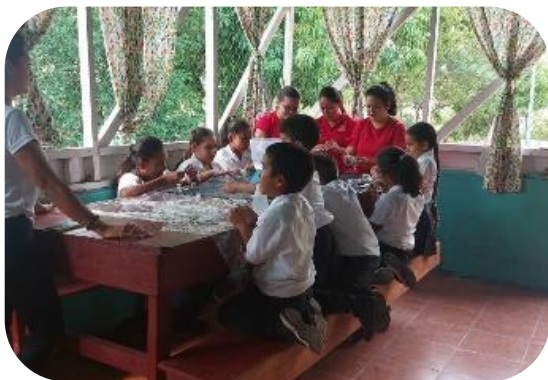
Estudiantes del equipo de producción visitan las escuelas.