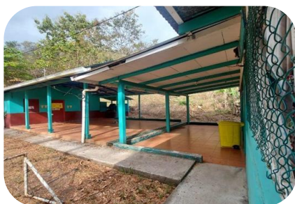
Escuela Punta del Río.