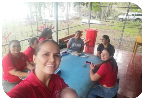
Estudiantes de la Universidad Nacional realizan entrevista al docente de Escuela Punta Cuchillo.