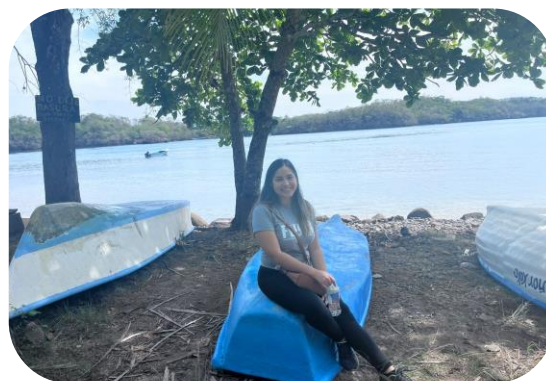
Estudiantes del equipo de producción visitan las escuelas.