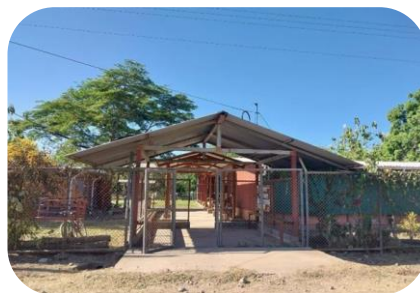
Escuela Santa Cecilia.