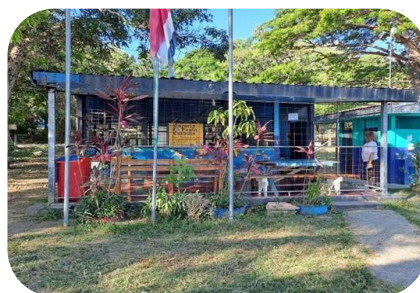
Escuela Punta Cuchillo.