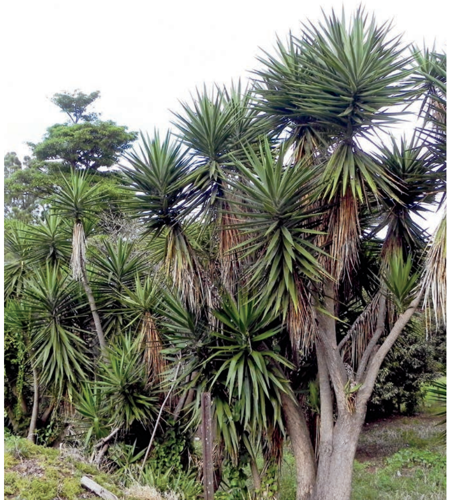
Presencia de Yuca guatemalensis (itabo) en taludes de ríos urbanos en el Valle Central, Costa Rica