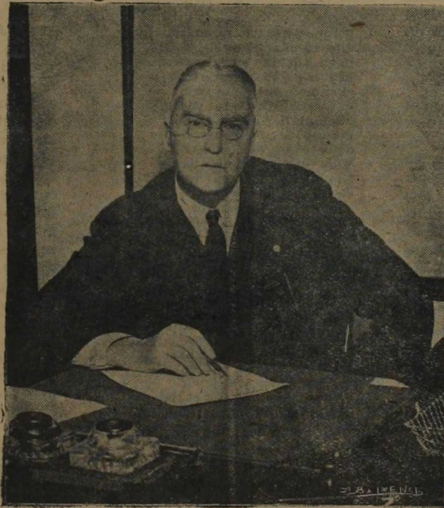
DR. FRANK CRANE

Mi padre fué capellán en el regimiento de Grant durante los primeros años de la Guerra Civil y por eso, cuando Grant fué presidente, ocupó el puesto de director de correos en Springfield, Illinois, lugar de nuestra residencia. La única razón que existía para que se hiciera este nombramiento