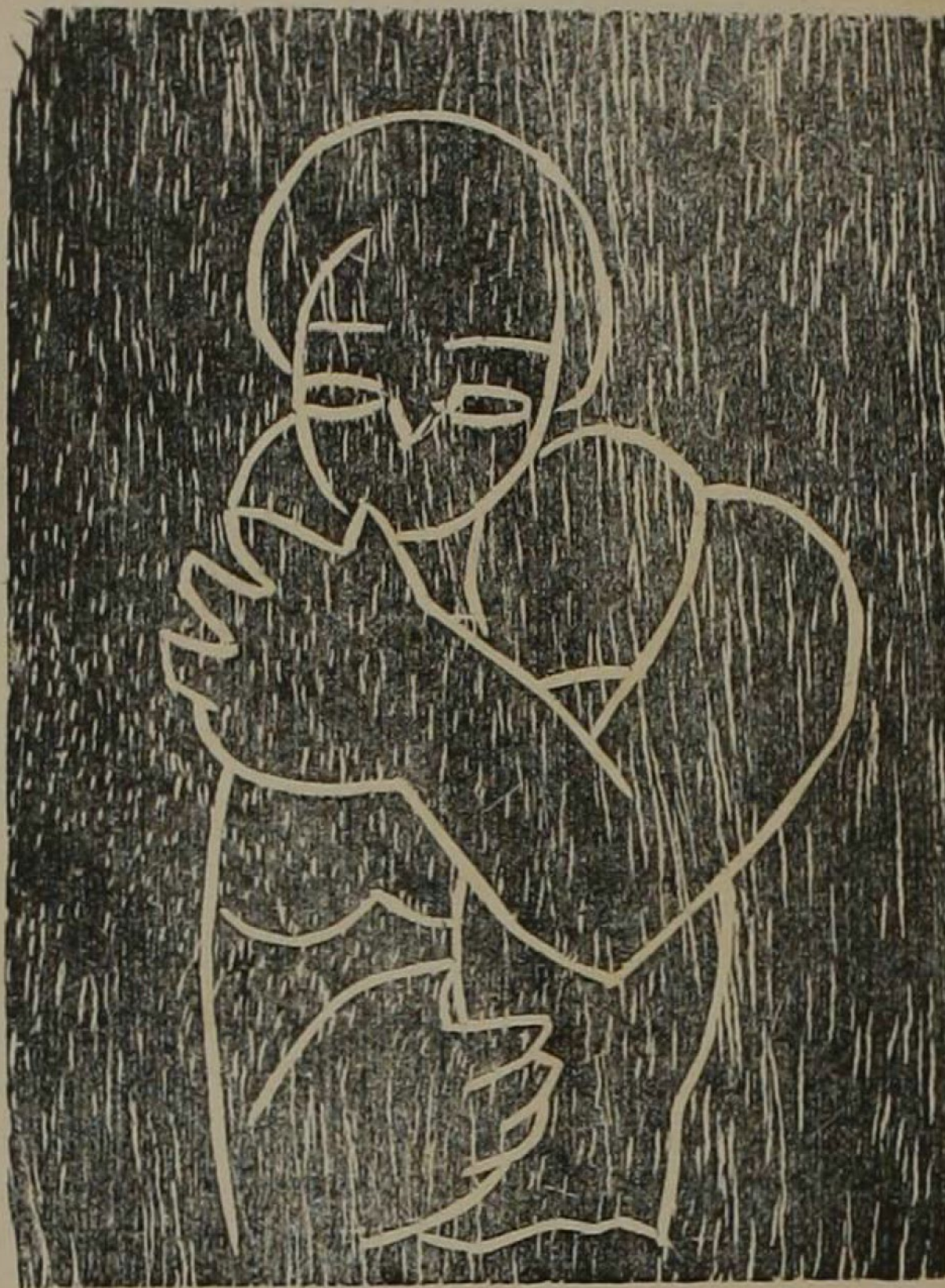
Madera de Amighetti.