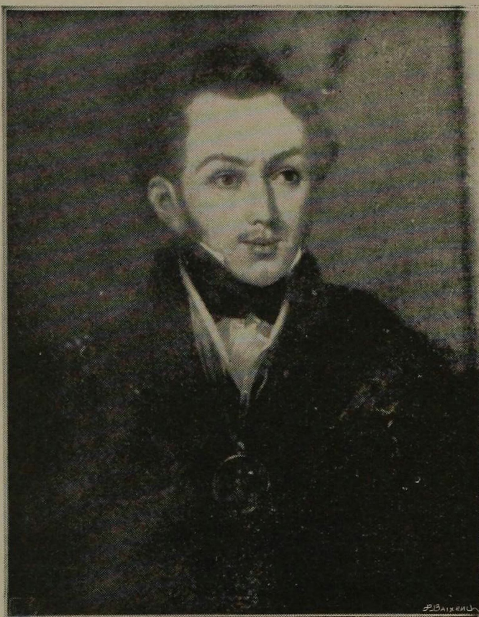
Bolívar en 1810

= De El libro de Oro de Bolívar , por Cornelio Hispano, París. Casa Editorial Garnier Hnos. 1925. =