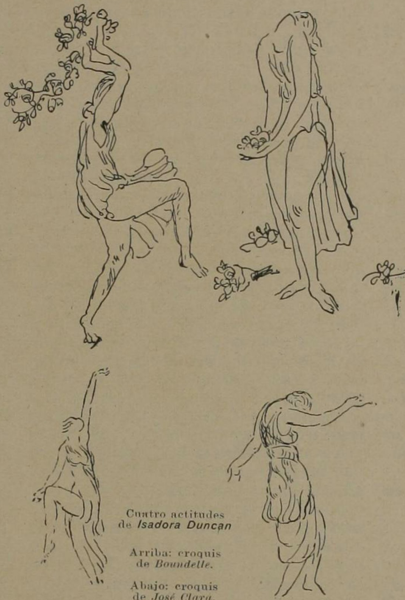
Cuatro actitudes de Isadora Duncan

=De Mi vida . Edit. CENIT. Madrid. 1929=