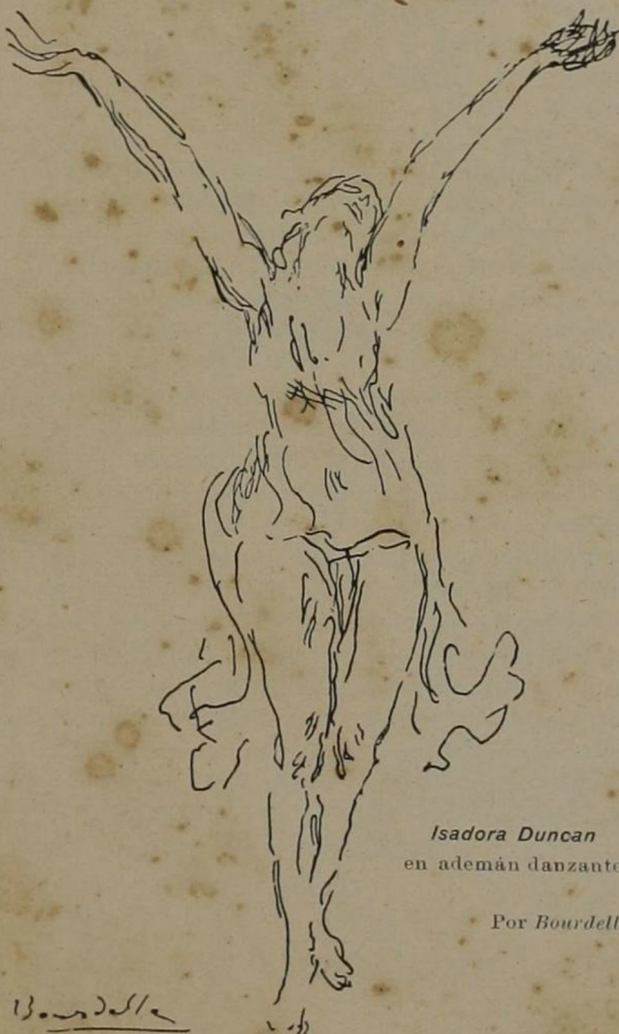
Isadora Duncan en ademán danzante